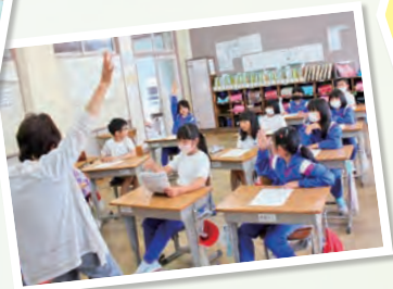
良いところ見つけ隊 による訪問授業