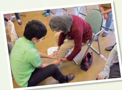
専門家ボランティアの指導に 熱心に耳を傾けます