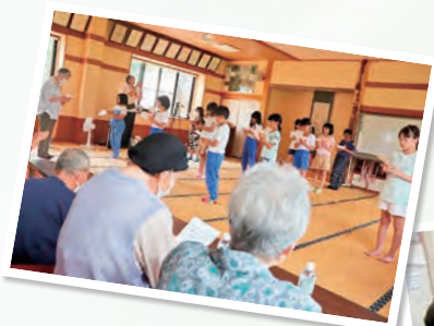
『めだかの学校』の歌にあわせて 会場全員で脳トレをしました

最後に児童から、気持ちを込めた肩もみ・肩たたきを、サロン参加者にプレゼント。高齢者と児童の笑顔と心の交流が深まりました。