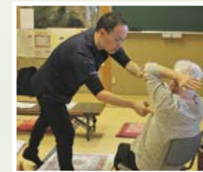
サロンのりんご(八坂)

専門家の丁寧な指導のもと、じっくり身体の健康について学べ、「大変参考になりました」等の感想をいただき好評でした。