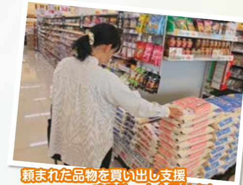
頼まれた品物を買出し支援する助っ人会員Kさん