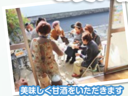
美味しく甘酒をいただきます

11月7日、新宿公民館にてお買い物市場が開催されました。前夜から雨、風強く心配でしたが当日準備の時間には眩しい太陽が顔をしてくれました。