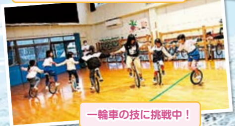
一輪車の技に挑戦中!