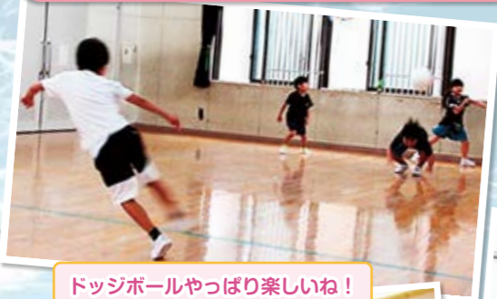
ドッジボールやっぱり楽しいね!

は今年150周年を迎えた八幡小学校の横にあります。ドッジボール、一輪車、ボードゲームなどで異年齢の友達と毎日楽しく遊んでいます。