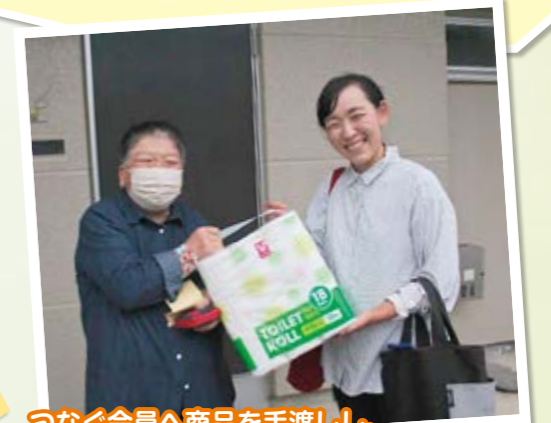
つなぐ会員へ商品を手渡しし、お礼のチクマ券を受け取って支援は終了します

「足の悪い私にとって、『つなぐ』はとても助かります。まわりの方々に支えてもらいながら、1日1日大事に生きていきたいと思えます。ありがとうございます。」