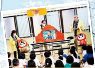
人権擁護委員会の方による紙芝居