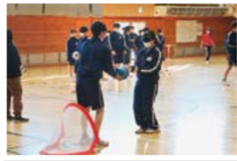
ブラインドサッカー体験の様子

体験を通して、言葉で表現することの大切さやコミュニケーションをとることの重要性について体で感じる事ができました。