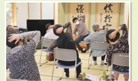
新山ききょう学園