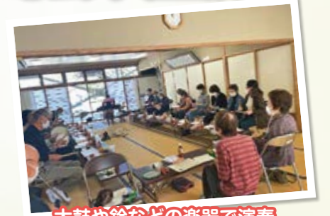
太鼓や鈴などの楽器で演奏

「いきいきサロン中町会」は毎月第2金曜日の9時30分から11時30分にサロンを行っています。子育て中のママさんや、お孫さんを預かっているおじいちゃんおばあちゃんもサロン大歓迎です。お待ちしております♪