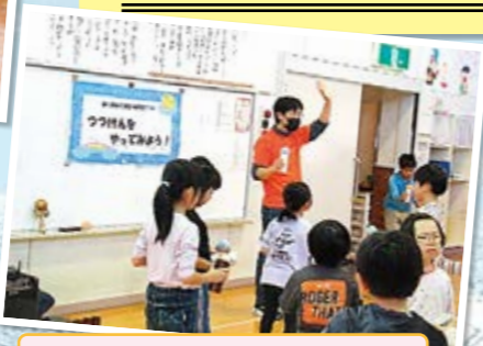
赤い羽根共同募金配分金による事業「つつけんをやってみよう!」

※詳細につきましては、各センター(館)にお問い合わせください。 ※参加する時は事前に各会場に申し込みが必要です。(各10組まで)