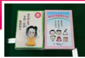
男女共同参画かるた