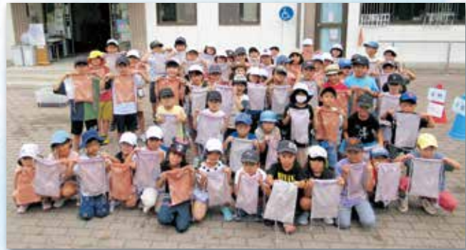
開花直前の桜の枝や玉ねぎの皮を使って、染色体験にチャレンジしました。

子どもたちは仲間と集団生活のきまりを守りながら、季節の行事や思い思いの遊びを楽しんでいます。