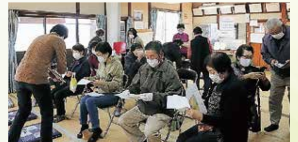
いきがやふれあいサロン (生萱地区)

だんだんと各地域でコロナと向き合いながら、サロンが再開しています。サロンの再開に向けて手を貸してほしいというお声がありましたら、ぜひ担当地域の生活支援コーディネーターにお声がけください。