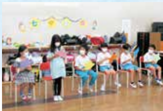
七夕集会 願い事の発表