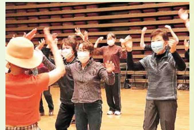
健康ディスコ in 戸倉創造館の写真

「音楽があれば体も動かしやすいし、誰でも気軽にできる」と小地域でもどんどん広がっています。