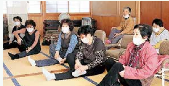
いきいきサロンふれ(20)の会 (雨宮地区)