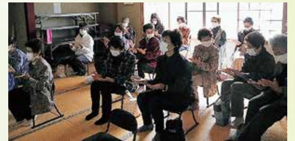
土口さわやかサロン (土口地区)