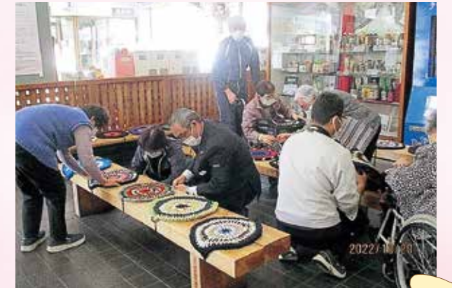
利用者様、職員、駅長様の皆で設置