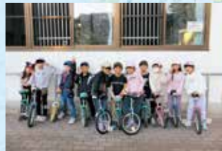
10月1年生一輪車スタート