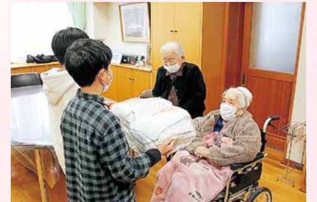
利用者様からぞうきんを児童へ

更埴デイサービス・戸上デイサービスでは地域貢献、社会貢献活動をすすめ、利用者様のやる気を引き出し、人のためになる喜びを共有していきたいと考えております。