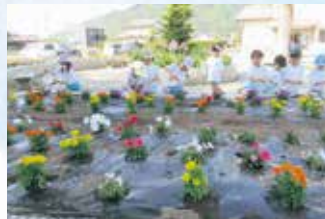
公園花壇の水やり