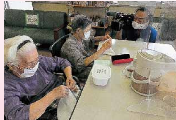
デイサービスでの裁縫活動

戸上デイサービスセンターでは、地域の皆様からご寄付で頂いたタオルを活用し、裁縫活動として、デイサービス利用者様に雑巾を縫っていただき、出来上がった雑巾は近隣の小学校に贈らせていただき、地域との繋がりを作りながら、地域貢献活動を行っています。