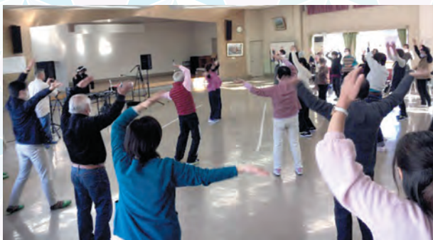
曲がかかると自然に身体が踊りはじめます♪

稲荷山地区生活支援コーディネーターが稲荷山地区民生委員の協力の下に、公民館を会場に予防ディスコを開催しました。活力や心身の低下など「フレイル（虚弱）」予防の一環として企画。市民へ参加を呼びかけ45名が参加しました。DJによるマイクパフォーマンスや本格音響が鳴らすダンスミュージックに会場は、踊りと笑いで盛り上がりました！高齢化社会に向けて、予防ディスコで心も体も元気に！！