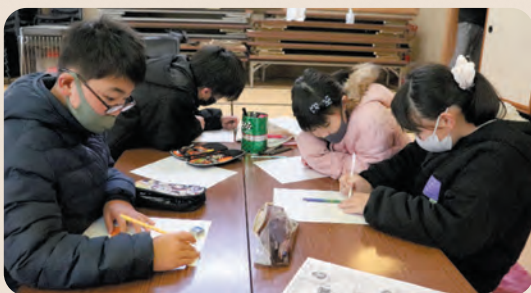
地域や小学校であった出来事を話し合いながら、うるわしっこ新聞を作ってます☆