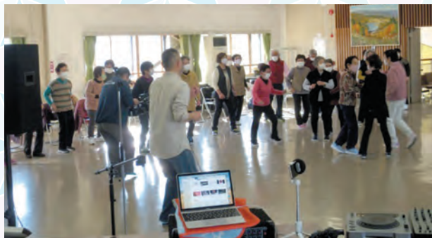
いつもと違う公民館の昼、格好良く、おしゃれにきめて、フィーバーします☆