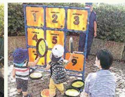
ストラックアウトゲーム

上山田の中央公園という資源を活かし、8月7日、温泉地区の皆様の交流の場「温泉ふれあい祭り」を開催しました。あん姫体操やフォークダンスで気持ちよく身体を動かしたり、子ども達がストラックアウトゲームで楽しみ、健康相談ブースでは、看護師による血圧測定から体調等の健康相談を実施しました。参加者からは「楽しく身体を動かして良かった」との感想もあり、健康と交流をテーマにした地域づくりが広がりました。