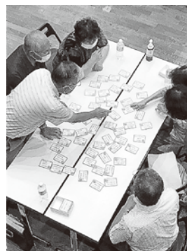
方言を楽しみながらのかるた体験

誰でも楽しめる「方言かるた」を、早速やってみたいとの声もあり、今後サロン活動の中での広がりが期待されます。