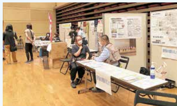
生活支援体制整備事業 相談コーナー

介護相談や健康相談などのコーナーもあり生活支援コーディネーターが地域の方々と交流する良い機会となりました。コロナ禍、人との交流を控えている高齢者や障がいのある方も来場し、久々の出会いに涙を浮かべる場面もありました。