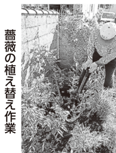
薔薇の植え替え作業