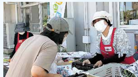
あたたかいつながり支援の輪が広がります