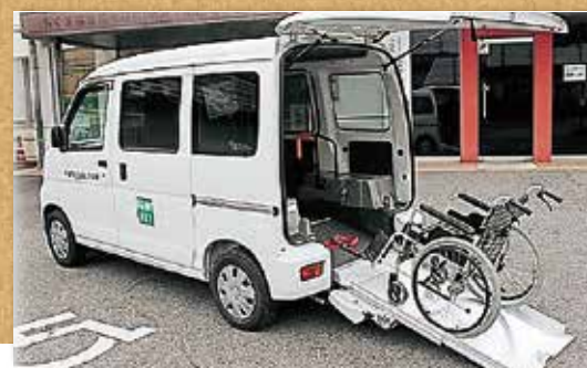
— 地域福祉推進事業 — 移送自動車・車いすの貸出、成年後見支援センター心配ごと・法律・結婚相談等