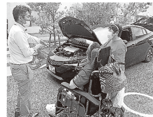
展示されたEV車から説明を受ける参加者

7月9日、恵愛学園を会場として、EV(電源)車による医療機器の充電デモンストレーションが行われました。いざという時のために、「医療的ケア児家庭とEV(電源)車ボランティアとのマッチングを核とした災害時にも生きる地域のつながりづくり事業」に取り組んでいます。