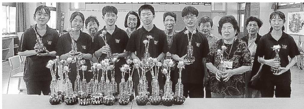
完成した折鶴フラワーと地域の先輩方、福祉委員の皆さん

9月8日、地域活動を行っている元気な先輩方と戸倉上山田中学校福祉委員の皆さんが、折鶴フラワー作品づくりを通して、中学校サロン(交流の集い)を行いました。完成した作品は地域の福祉施設へ寄贈します。