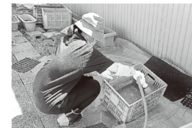
汚れたカゴの水洗い