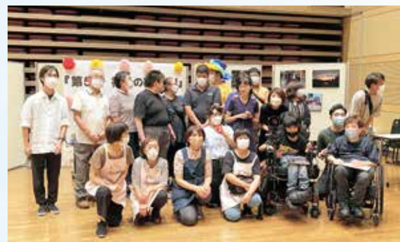
18人の勇士（実行委員）が集まりました