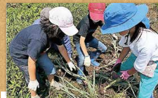
— 地域の福祉活動事業(支部社協事業) — 子どもわくわく体験教室、障害者スポーツ体験教室福祉体験教室、災害見舞金、各種団体事業助成等