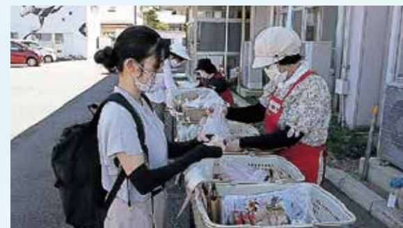
配布のサポートをする生活支援コーディネーター