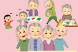
つどいの場を作ります