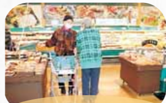
自分で選ぶのは楽しいね!

生活支援コーディネーターが東部地区で訪問聞き取りを行い、買い物に不便を感じている高齢者のみなさまの声を拾いました。