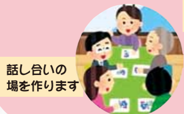
話し合いの場を作ります