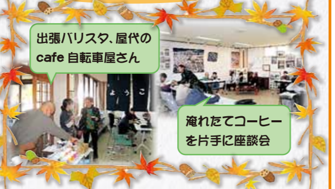
出張バリスタ、屋代のcafe 自転車屋さん