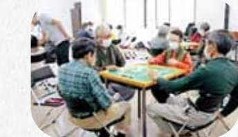
空間・時間・仲間で「さんま」

千曲市初の「買い物支援試行」は地域のニーズより生まれた試みで、倉科地区の高齢者のみなさまがAコープあんず店でお買い物を楽しみました。このように、私達生活支援コーディネーターは高齢者支援のしくみづくりを進めてまいります。