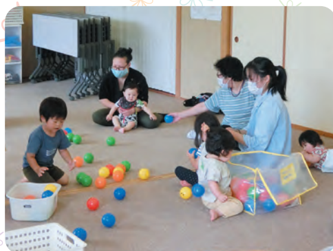
右下 更級児童館 子育てひろば ～ボールをいっしょに集めるぞ～