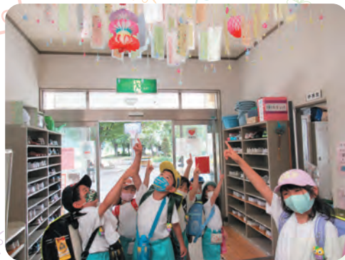
右上 五加児童館 七夕飾り ～みんなの願いが叶いますように～