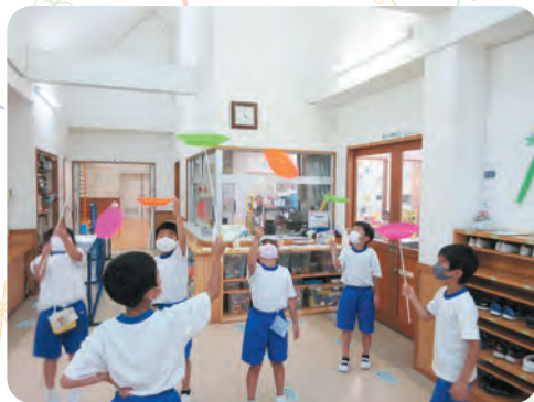
左上 東部児童センター 血回しがブームです ～ソツをつかめばご覧のとおり～