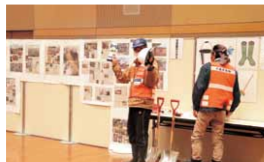
ボランティア活動装備や資材の説明