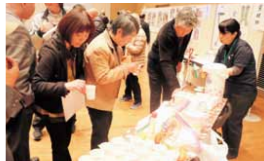
“じゃがりこ”にお湯を注いでポテトサラダのできあがり