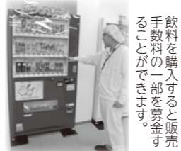
飲料を購入すると販売手数料の一部を募金することができます。

新規社屋の建設や増設など新たに自動販売機の設置を検討されている法人の皆さまへ気軽にできる社会貢献の取り組みとして、ぜひ赤い羽根共同募金の募金型自動販売機の設置についてご検討をお願いいたします。