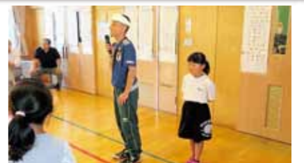
▲地域福祉課・埴生支部による夏休み福祉体験 坂城、レインボーさん(ブラインドサッカー)