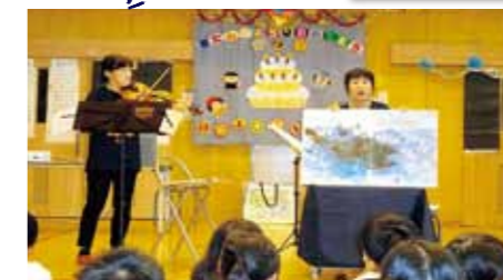
▲ぼかぼかさんミニコンサート