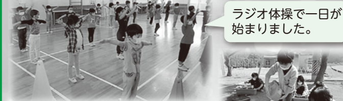
ラジオ体操で一日が始まりました。

新型コロナウイルス感染拡大防止のための小学校の臨時休校中も放課後児童クラブは開所しました。