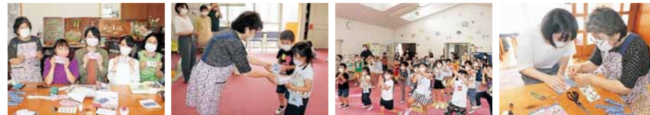
心を込めて作りました 児童館へ手作りマスクをプレゼント 子ども達からのお礼の踊りに、感動しました 優しい指導で、楽しく作業が進みました

地域の皆様から「おかめちゃんのマスクの作り方」を教えて欲しいとの連絡があり、お宅へ教えるに伺いました。裁縫に長けていらっしゃる方も、おかめちゃんグループの縫い方の工夫や見た目のデザインに感嘆の声を上げていました。