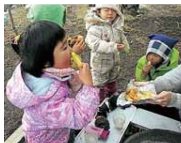
整備された施設とぼっこでの様子