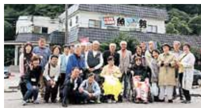
五加支部ぬくもり昼食会