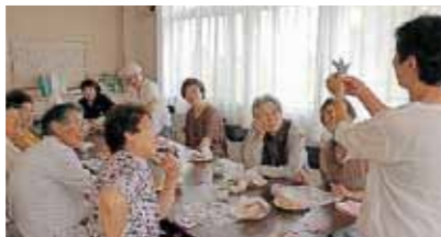
埴生支部児童福祉体験(シッティングパレー)