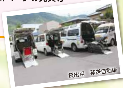
貸出用 移送自動車

移送自動車の貸出・車いすの貸出 心配ごと相談・法律相談 出張法律相談・結婚相談 法人運営等(理事会・評議員会等) ホームページの充実等