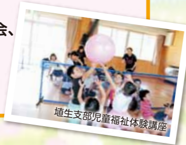
埴生支部児童福祉体験講座

11支部(森、倉科、雨宮、屋代、埴生、稲荷山、 八幡、戸倉、更級、五加、上山田) 一人暮らし高齢者昼食会・在宅介護者の集い 障がい者希望の旅・子ども料理教室・福祉体験教室など 各種団体・事業助成 (日赤奉仕団、ひとり親家庭の会、 更生保護女性会、防犯協会、 育成会、身体障害者福祉協会、 民生児童委員協議会など)