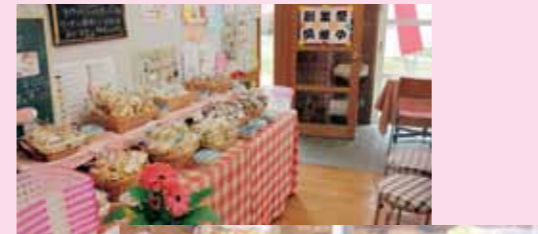
クッキーとケーキは全て手作り！ 季節のケーキ 大人気

今後も皆さまに喜んでいただけるようなおいしいお菓子を作っていきますので、皆さまぜひご来店ください。お待ちしております。