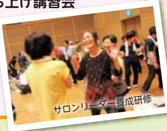
サロンリーダー養成研修

福祉教育 地域支え合い事業「つなぐ」 災害ボランティアセンター立ち上げ講習会 サロンリーダー養成講座 ボランティア団体支援・調整 社協だより発行 ボランティア情報誌 「かけはしちくま」発行など