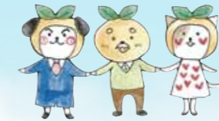
た一坊 助さん あいちゃん ～3人そろってたすけあい～

千曲市社会福祉協議会は誰もが安心して暮らすことのできる福祉のまちづくりを目指し、地域の皆さまをはじめ、ボランティア、関係団体などと協働しながら日々活動しています。社協会費は社協が実施する地域福祉事業や地域で行われている福祉活動事業の大切な財源となっています。会費のお願いは7月を強化月間としていますが、各区・自治会の実情に合わせ協力をお願いしております。(すでに会費を納入いただきました皆さまには、厚く御礼申し上げます。)