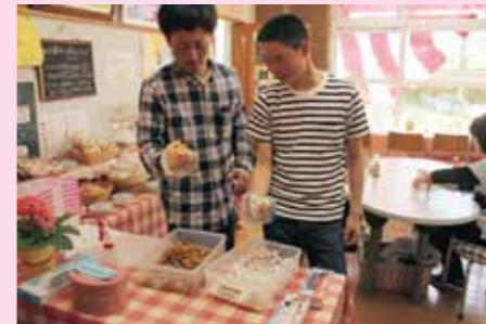
大好評のクッキーのつかみ取り