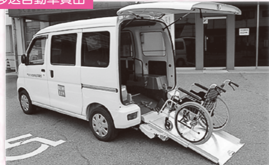
— 車イスやストレッチャーのまま乗れる車の貸出 —