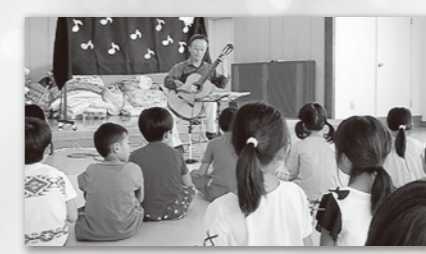
▲いい音色だね(ギター演奏会)