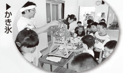
何の味にしようかな