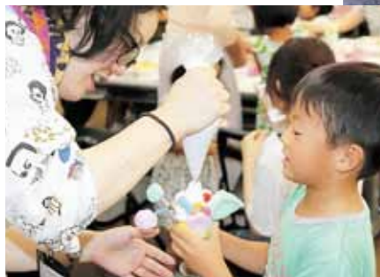
親子でパフェづくり