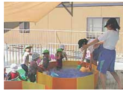
わっ冷たい! 保育園でプール遊び

○この児童館のOBで、恩返しのため来ました。子ども達がとてもかわいいです。やる気ができます。(中学二年)