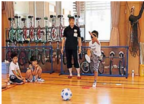
ゴールにむかってシュート!!