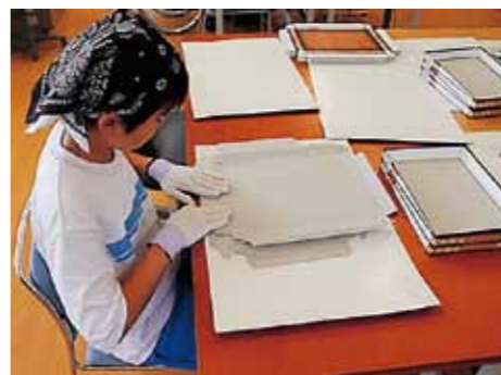
就労施設で箱折りの様子

○保育園の子どもから話しかけてくれて楽しかったです。機会があれば、またやってみたい。(中学二年)