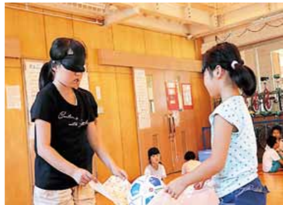
アイマスクを付けてボール運び