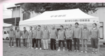
千本柳区防災テント購入