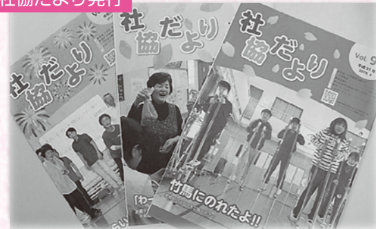
— 社協事業紹介など 年6回偶数月発行 —