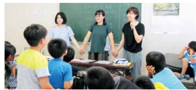
さあわかるかな! まちがえ探しの様子

参加した子ども達からは「夏休みは友達と会えないけど、ここに来れば、話したり遊んだり勉強することができていい。」「勉強がいつもよりたくさんできる。」「との声が聞かれました。 サロン代表の方は、「この活動がモデルとなっていて、いろんな場所に広がってくるといいですね。」と話してくださいました。