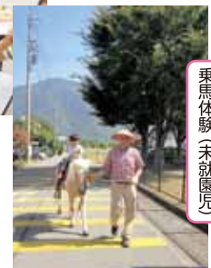
乗馬体験(未就園児)