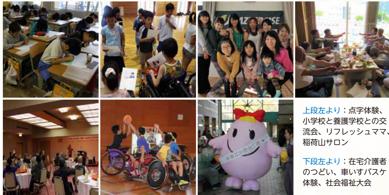
上段左より：点字体験、 小学校と養護学校との交 流会、リフレッシュママ、 稲荷山サロン

ボランティア団体・自治会等への助成 支部社協 (森・倉科・雨宮・屋代・埴生・稲荷山・八幡・ 戸倉・更級・五加・上山田) への助成 等