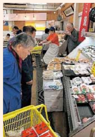
さかなや魚勢にて買い物