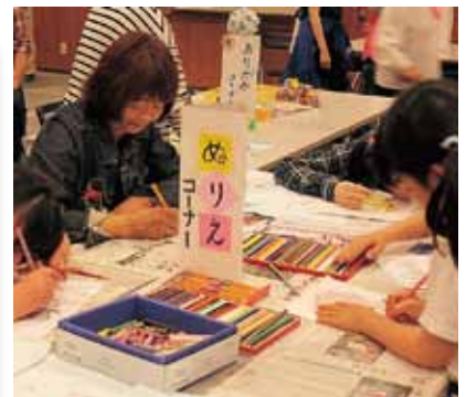
ボランティア運営委員の活動の様子「イベントへの参加」