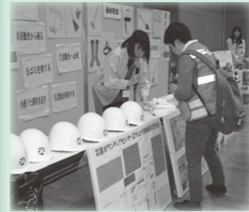
昨年度運営シュミレーションの様子