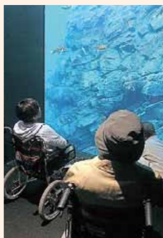
上越市水族博物館にて見学

支部社協主催の希望の旅が9月27日(木)に開催されました。 この希望の旅は、普段出かける機会が少ない障がいをお持ちの方を対 象に、皆様からご協力をいただきました「社協会費」「赤い羽根共同募 金配分金」を活用し、毎年実施しています。 今年は27名の参加者があり、「普段バスに乗ることもないから、それ だけで嬉しい！」「誰かにお土産を買うのは久しぶりだなぁ、何がいい かな？」との声が聞かれました。たくさん笑顔あふれる旅となりました。