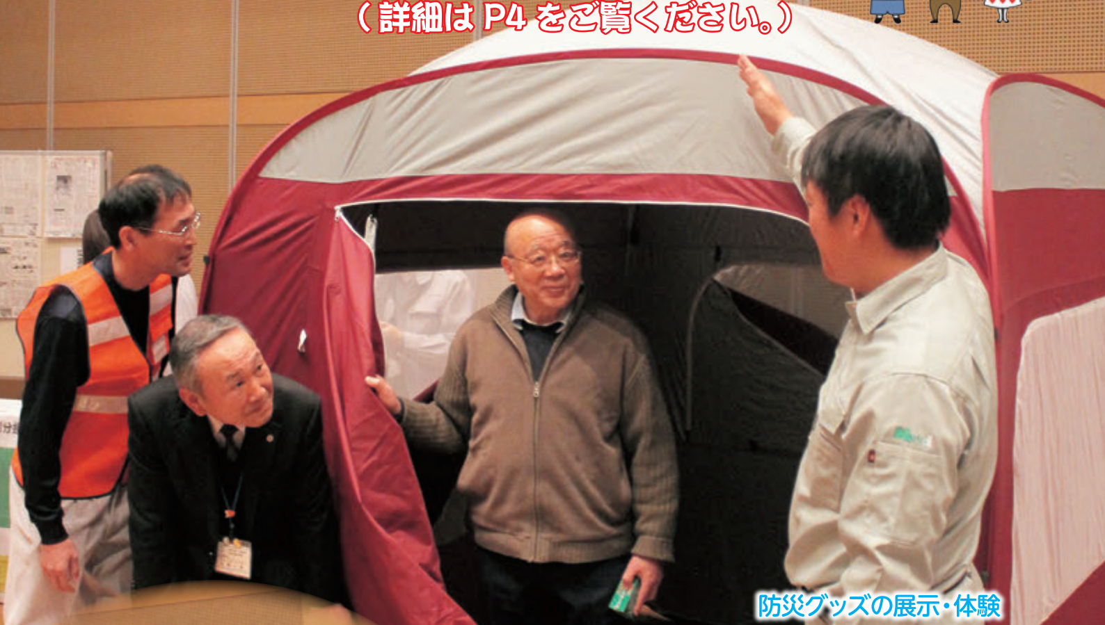
防災グッズの展示・体験