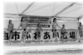
千曲市ふれあい広場

主な取り組み：ふれあい広場、サマーチャレンジボランティア、福祉教育支援、サロンリーダー研修、コミュニティカフェ養成講座、災害ボランティア講座など