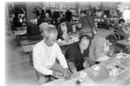
11 支部主催 「障がい者希望の旅～高崎だるま絵付け体験～」

支部事業の原資となる社協会費募集や赤い羽根共同募金運動を支部役員と協働しながら実施しました。