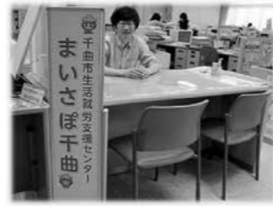
戸倉庁舎内相談窓口

また、社協基盤の強化と安定した法人運営を図るため第 2 次経営戦略計画の策定に取り組みました。