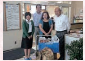
千曲商工会議所女性会 様 ▶

●フードドライブ(米、乾めん、缶詰、レトルト食品一式) ・千曲市男女共同参画推進連絡協議会 様 (総会、映画会開催時実施) ・更埴ライオンズクラブ 様 ・千曲商工会議所女性会 様 生活困窮者へ