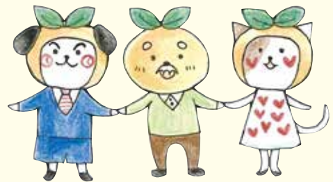
た一坊 助さん あいちゃん

「た一坊」「助さん」「あいちゃん」です。 3人そろって「たすけあい」です。 千曲市社協のことをもっと知って欲しいのでたびたび登場しますがみなさんよろしくお願ひします!!