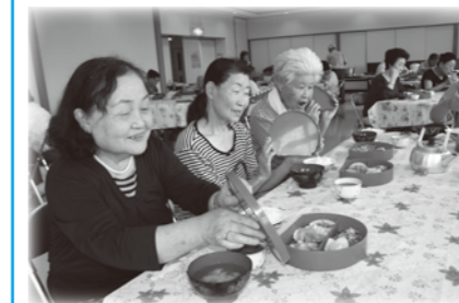
(一人暮らし高齢者昼食会)