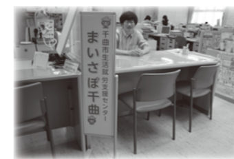
戸倉庁舎内相談窓口

平成 27 年 4 月に施行された生活困窮者自立支援法のもと生活困窮者自立相談支援事業を市から受託し、相談員 2 名を戸倉庁舎に配置しました。失業や就労意欲の欠如などから生活困窮状態になった方への相談・支援を行いました。