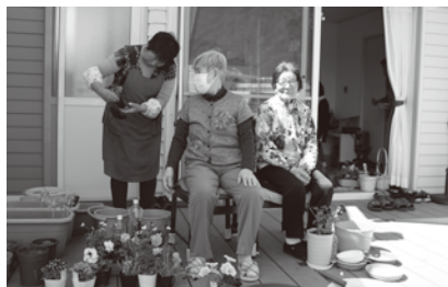
▲昼食後も 16 時までカフェを開き、季節に応じた余暇活動をしています。