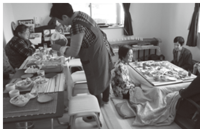
▲毎回 15 名ほどが昼食を共にします。