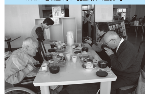
森・倉科・雨宮・屋代・埴生・稲荷山・八幡支部主催「障がい者希望の旅～能生海岸で昼食～」