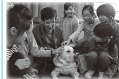
(視覚障がいと盲導犬ついて学ぶ)