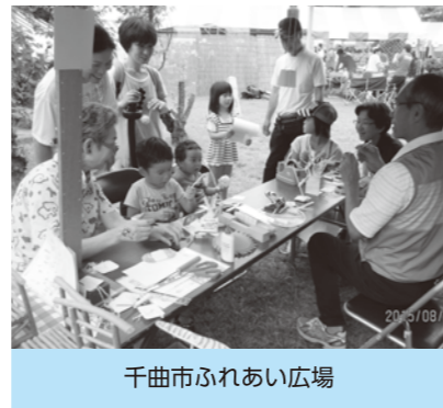
千曲市ふれあい広場