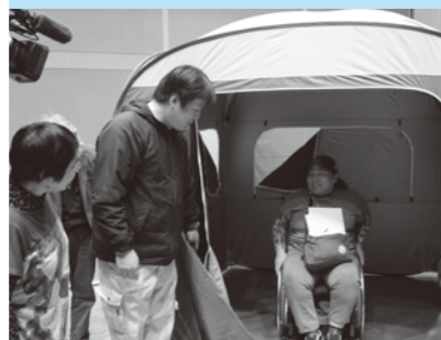
災害救援ボランティアセンター立ち上げ訓練「仮設トイレ体験の様子」

ふれあい広場、サマーチャレンジボランティア、福祉教育支援、サロンリーダー研修、傾聴ボランティア養成講座、災害ボランティア講座など