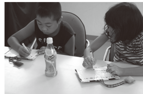
上山田支部「こどもわくわく教室」要約筆記組のボランティアの方と筆談用具作成と筆談体験

支部事業の原資となる社協会費募集や赤い羽根共同募金運動を支部役員、区・自治会の役員の方々と連携・協働しながら実施し、その助成金や配分金で地域の福祉活動の中心となる支部事業や団体助成等を各支部長はじめ関係者の方々と相談しながら実施しました。(支部事業は P4 をご覧ください。)