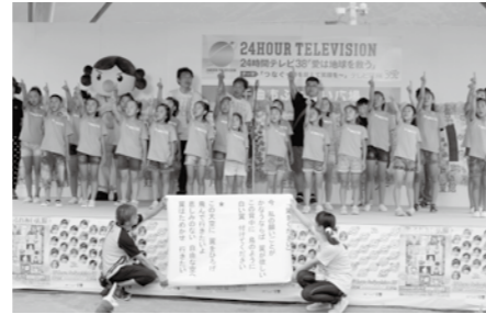
千曲市ふれあい広場-実行委員会と児童との合唱

事前に実施したアンケート調査（市民満足度調査）や地域からの意見で様々な課題が上がりました。