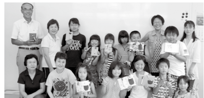
夏休み体験教室・障がい者への理解 点字、要約筆記の体験

地域や関係機関、社協が積極的に福祉活動を展開し、より豊かな地域の福祉をつくることを目指します。