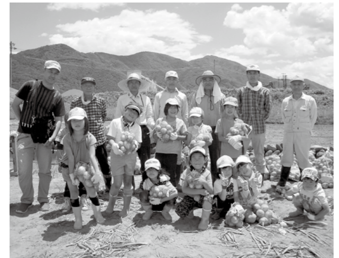
世代間交流 農業体験 協力してたまねぎの収穫