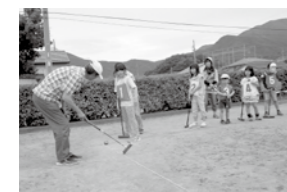
▲ゲートボール教室