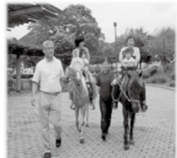
▲動物触れ合い体験