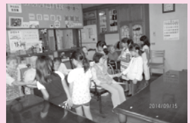
地域交流 ‘敬老園訪問’

上山田児童館 は 0～18歳までの児童を利用対象とする自由来館制の児童館です。 日曜・祝日も開館しており、地域ボランティアの方々に支えられた活動を行っています。