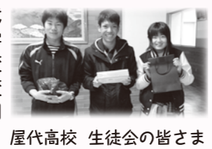
屋代高校 生徒会の皆さま

屋代高校・付属中学校 / 屋代南高校 / 屋代小学校 / 東小学校 / 埴生小学校 / 治田小学校 / 八幡小学校 / 屋代中学校 / 埴生中学校 / 更埴西中学校 / 戸倉小学校 / 更級小学校 / 五加小学校 / 上山田小学校 / 戸倉上山田中学校