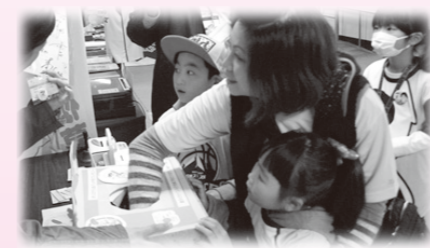
バスケット会場で募金してくださった方 抽選で何が当たったかな!?