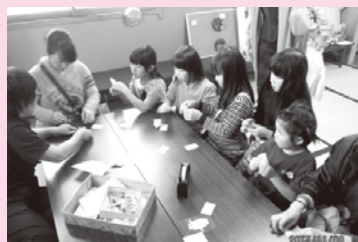
上山田文化祭での ‘出前児童館’