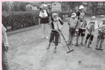
「ゲートボール協会」の皆さんと ‘ゲートボールを楽しむ’