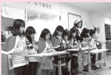
地域交流 ‘あっとほーむ上山田訪問’

上山田児童館 は 0～18歳までの児童を利用対象とする自由来館制の児童館です。 日曜・祝日も開館しており、地域ボランティアの方々に支えられた活動を行っています。