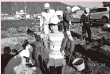
「ほたるの会」の皆さんと ‘さつま芋掘り’