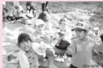
「ほたるの会」の皆さんと ‘焼き芋大会’