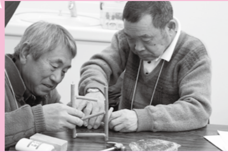
(木工ボランティア養成講座)

ボランティア活動やボランティアを始めるきっかけづくりの支援、福祉教育活動の支援など行います。