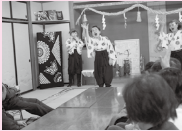
本格的なマジックに会場は大盛り上がりです。

「わらべ」と地域のお年寄りの笑顔をつないだのが新宿いきいきサロンのスタッフです。ボランティアの皆さんが運営し、手作りの漬物や手遊び等で地域のお年寄りに交流の場を提供しています。「また来るよ」の言葉がやりがいと話す皆さん、参加者の笑顔がスタッフの元気のヒケツになっています。