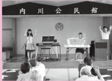
(一人暮らし高齢者の昼食会)

市内11の支部では、地域に合った福祉活動を展開しています。(高齢者・障がい者の方への支援、子どもたちの福祉活動など)