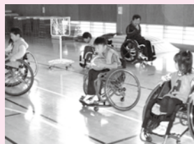
車いすバスケ、難しいな