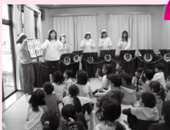
ハンドベルコンサート