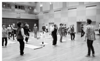
研修会でお互いに学びます

「退職後から始め、自分も健康になりました。活動を通じて、市民の皆さんと楽しくふれあうことが出来るようになりました。自分の体が続く限り、活動を続けていきたいと思っています。」「若い人が会員になって下さればありがたいんですけど・・・お待ちしています。」と満面の笑みでお話してくださいました。