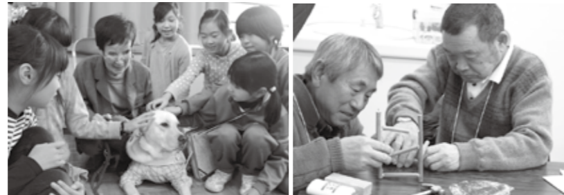
屋代小学校 4年生福祉教育体験学習「目の不自由な方と盲導犬との生活を学ぶ」

ふれあい広場、サマーチャレンジボランティア、福祉教育支援、サロンリーダー研修、男性向けボランティア養成講座（木工ボランティア）、災害ボランティア講座など