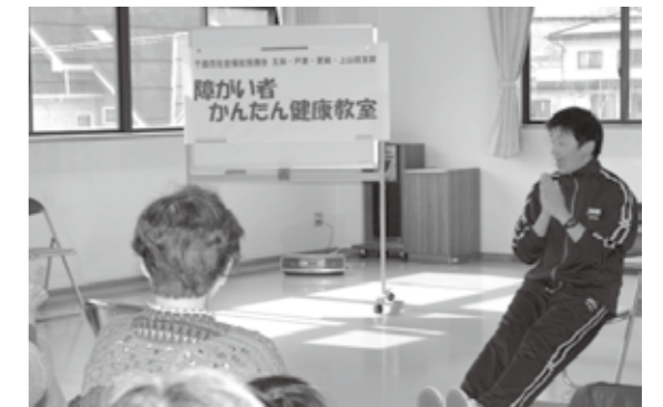
戸倉・更級・五加・上山田支部「障がい者支援事業」かんたん健康教室