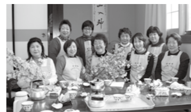
サロンスタッフの皆さん

準備は大変ですが、お年寄りから「今日も楽しかったよ。」「次回も楽しみにしているよ。」「と言われると励みになりますし、やりがいを感じます。健康づくり応援団さんの存在はありがたいです。私たちも勉強になりますとご自身も楽しまれながら、お年寄りとボランティアさんを繋いでいます。