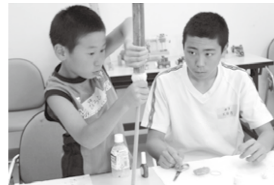
上山田支部「こどもわくわく事業」地域のボランティア&中学生のお兄さんと工作で交流