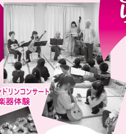
マンドリンコンサート & 楽器体験