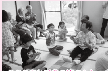
ささえあい千曲の皆さんと 伝承遊びを体験