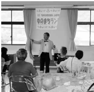
食事後のマジックショー

●成り立ち…旧上山田町社協時代から実施されていた配食サービスや昼食会を前身として始まりました。