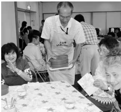
作りたてを配膳します