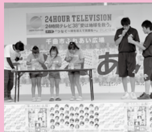
大人も子どもも本気です！ジュース早飲み選手権

市内外の団体で構成される実行委員が、当日のステージ発表や出店で会場を賑わせました。今年度も24時間テレビ38「愛は地球を救う」とのコラボレーションにより、千曲市のふれあいの様子は県下に生中継で発信されました。