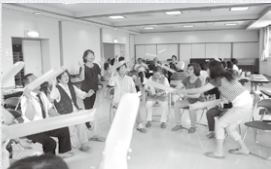
ボランティア活動支援 — サロン活動を学ぶ サロンリーダー研修 —