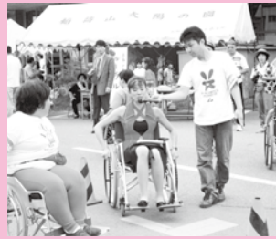
車イス体験。更埴市時代から現在まで続くふれあい広場の伝統的コーナーです。