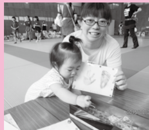
ママさんたちもがんばりました！屋内会場・子育て広場