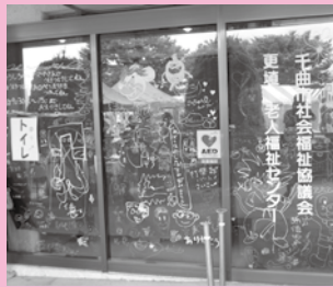
役目を終えた更埴老人福祉センターに想いを残しました。