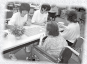
森の里デイサービスセンターにて。利用者様とお話ができて楽しいです。

今年も7月29日～8月29日までの1か月間サマーチャレンジボランティア in ちくま（通称：サマチャレ）が開催されました。市内の中学生・高校生を中心に総勢169名が参加、市内39団体の福祉施設にご協力をいただきボランティア体験をしました。