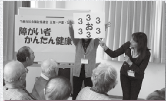
戸倉・更級・五加・上山田支部 — かんたん健康教室 障がい者支援事業 —