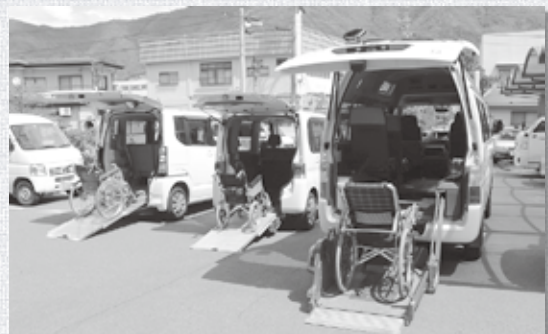
福祉自動車貸出 — 車いすやストレッチャーで通院等できる貸出車 —