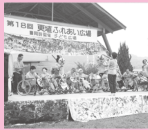
手作りのメインステージ。テントも学校や幼稚園など様々な機関から集めました。

ふれあい広場はもともと更埴・戸倉・上山田の3地区に分かれて開催されてきました。なかでも更埴体育館前広場を会場とした更埴ふれあい広場は最も歴史が長く、第二回の開催は1980年代にさかのぼります。開催のきっかけは「障がいを持つ人たちが広場に連れ出し、みんなで交流をしたい」という地域の方の言葉。そこにボランティアをはじめとした地元有志が集い、約20団体の参加でスタートしました。以来、更埴体育館前広場の開催は、更埴市時代、千曲市時代合わせて30回を数えます。