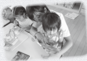
あかね北保育園にて。子どもたちに声をかけられ嬉しかった。将来は保育士を希望しています。