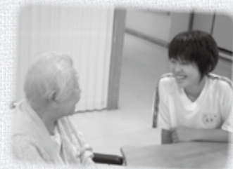
吉野の里にて。「ありがとう。」と言われ嬉しかった。