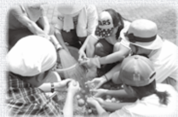
チューリップの家にて。じゃがいも収穫のお手伝い。