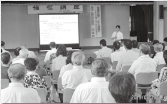
埴生支部 — 福祉のまちづくりを学ぶ 福祉講座 —