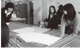
▲ねまき製作の様子

・日頃勉強している裁縫の技術を活かしてねまきを作り、高齢者や身体の不自由な方のために少しでも役に立ちたいです。