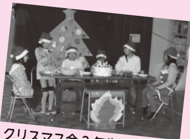
クリスマス会 3年生による劇