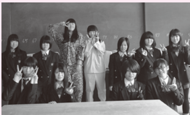
屋代南高ライフデザイン科3年ファッションコースの皆さん