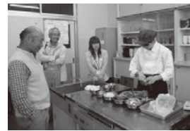
▲生産者との試食会