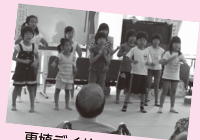
更埴デイサービス訪問