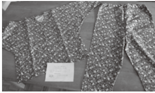
▲介護用パジャマ「らくらくねまき」

屋代南高校では、昭和59年より自分達で製作した介護用パジャマ「らくらくねまき」を福祉施設等へ寄贈しています。ねまきの総寄贈数は千着を超えました。ファッションコースの生徒は在校中に一人一着のねまきを作るので、過去千人以上の卒業生が製作してきた歴史ある取り組みです。ねまきも寄贈した方々の意見を取り入れながら浴衣型からパジャマ型へ、無地から柄物へと改良され、時代の流れと共に進化してきました。授業の一環として製作するだけではなく、外の世界に目を向け、実際に使用する人のことを考え取り組んでいます。