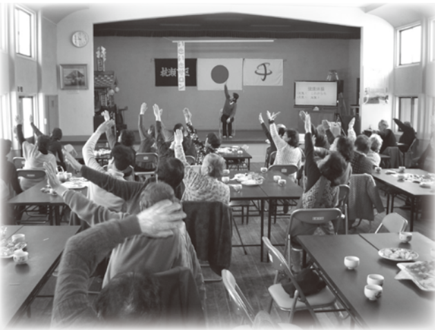
健康体操で楽しく体を動かし、こころも体もリフレッシュ！

老夫婦、ひとり暮らし子育て中の親子などの皆様にご参加いただけます。会場は公民館で、2か月に1回開催しています。詳しくは、区の回覧か民生児童委員さんにお尋ねください。多くの方のお越しをお待ちしています。