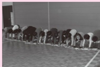
心ひとつにぞうきがけ