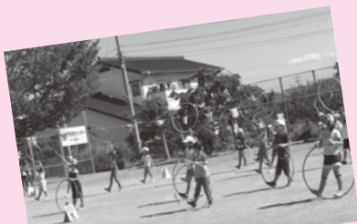
力を合わせて運動会