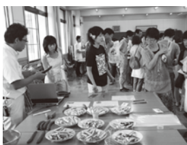
▲地元食材の試食コーナー