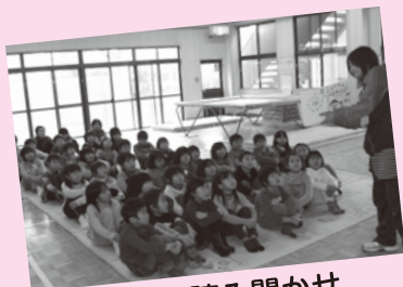
毎日の読み聞かせ