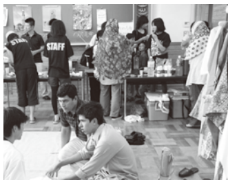
▲文化祭に招いて交流