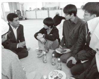
▲モスク訪問の様子

・偏見を持たずに接することは異文化間だけではなく、地域間や人間同士でも重要だと思う。