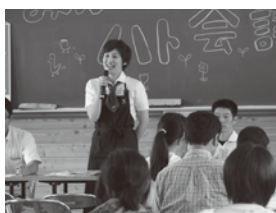
▲野菜ソムリエのお話

・今年度は昨年度以上に、多くの方々に「おもしろい!」と思っていただき、食に関心を持ってもらえるような企画にしたいです。