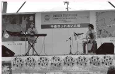
○ステージ発表 (屋外 or 屋内)