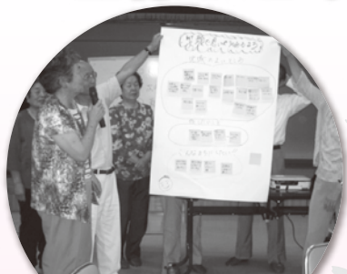
殖生支部 福祉講座「はちの縁側をみつけよう」