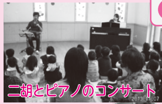
二胡とピアノのコンサート