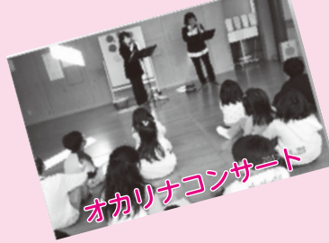
オカリナコンサート