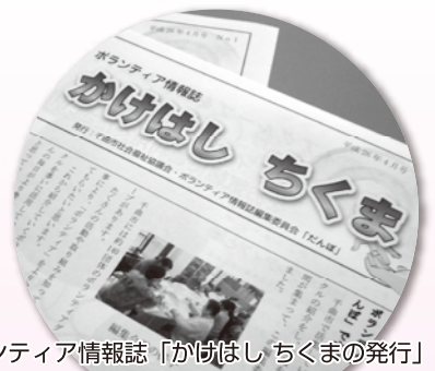
ボランティア情報誌「かけはし ちくまの発行」