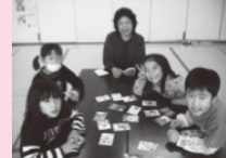
地域の方とのふれあい会