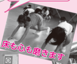
床も心も磨きます