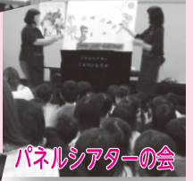
パネルシアターの会