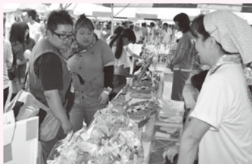
○出店 (屋外 or 屋内)