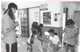
サマーチャレンジ ボランティアinちくまの取材