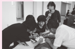
サロンリーダー研修等 センター事業の準備や運営