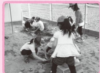
夏場は砂遊びも人気がありました。