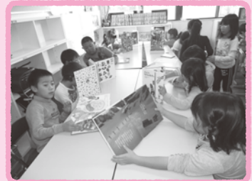
まずは10分間読書でスタートします。