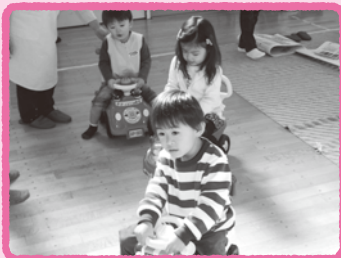
午前中は乳幼児と保護者の方に解放しています。(子育て支援)