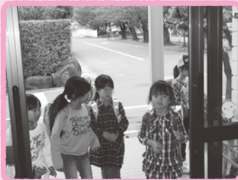
「ただいま」と元気な声とともに来館してきた1年生。