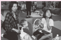
子育てネットワークの 立ち上げ支援