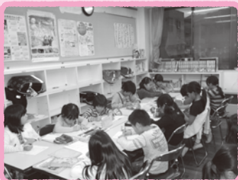
宿題は多いかな？でもがんばらなくちゃ