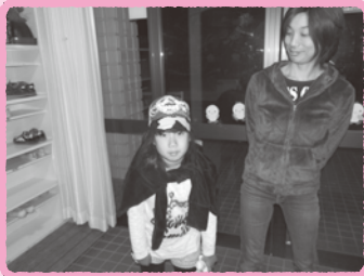
「さようなら」お母さんのお迎えです。