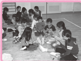
「美味しいよ！」楽しいおやつ時間