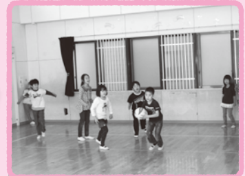
学年は関係なく夢中で遊んでいます。