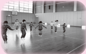
自分の目標に向かって真剣勝負！