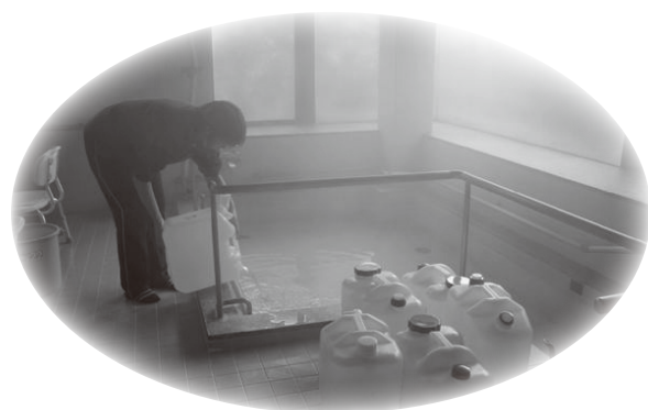
* 温泉を浴槽へ投入