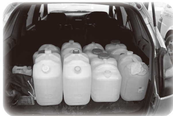
* 温泉を車で輸送します