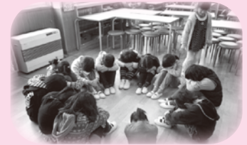
「オニ、誰にしようか？」