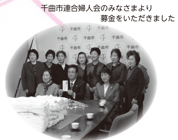
千曲市連合婦人会のみなさまより募金をいただきました

ご協力いただきました募金の使い道につきましては、インターネット赤い羽根データベース「はねっと」に詳しい情報が掲載されておりますのでご覧ください。 www.akaihane.or.jp