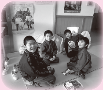
カード遊びが大好きな諸君！