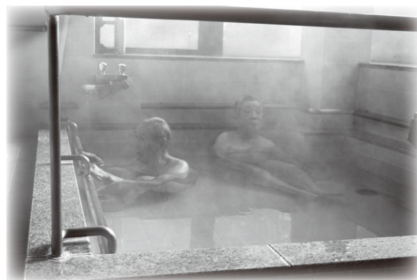
* 温泉成分で温まる利用者の皆さん