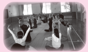
午前中の子育て支援「～ママたちのヨガ体操～」