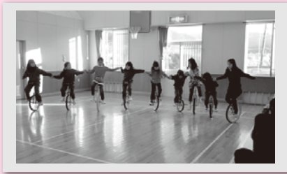
上級生と一緒に仲良く♡