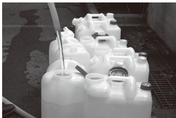
* ポリタンク温泉注入

温泉臭が漂う浴室は、温泉気分が満喫でき、利用者の方に大変喜んでいただいております。