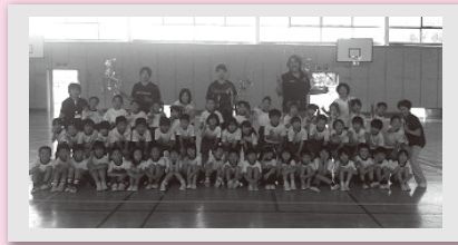
信州プレイブウォリアーズの選手にバスケを教えてもらいました