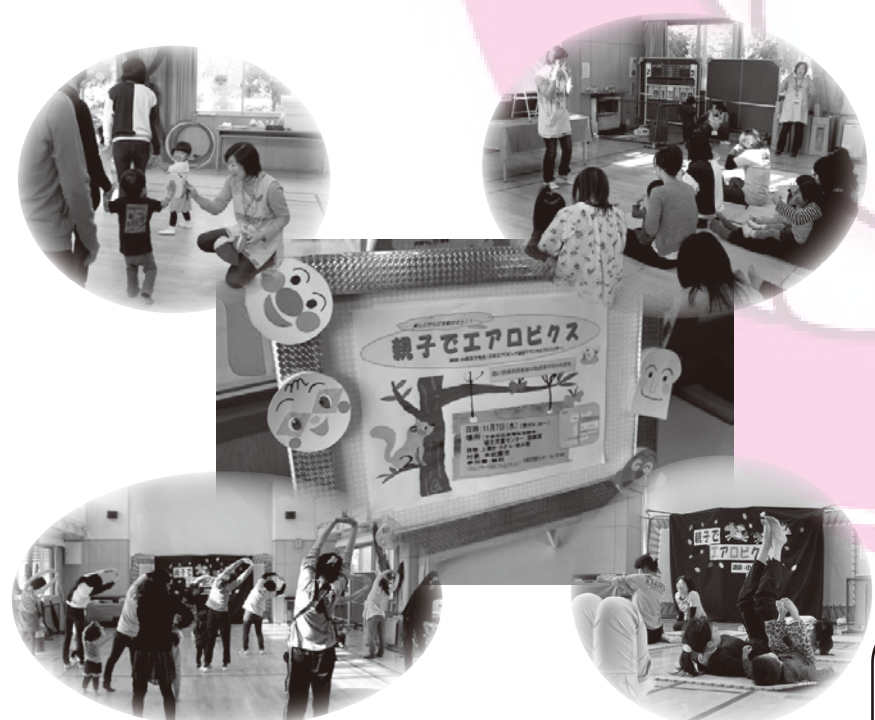
赤い羽根共同募金の助成金で開催した埴生児童センター「親子でエアロビクス」