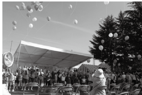
昨年も多くの子が参加されました。

〈対象者〉 高校生・大学生・短期大学生・専門学校生 〈参加費〉 300円(ボランティア活動保険代) 〈定員〉 15名 〈申込期限〉 6月28日(金)までにお電話下さい。