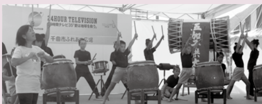
ボランティア・市民交流活動事業（ふれあい広場）