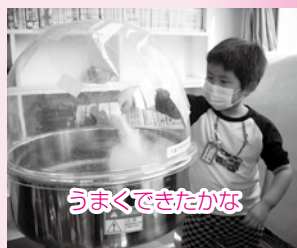
うまくできたかな

一人ひとりのお子さんにとって居心地のよいセンター作りを基本にして お子さんたちのよりよい成長を願って運営しています。 また、読み聞かせ、オカリナ演奏、一輪車指導のボランティアの皆様、ありがとうございました。