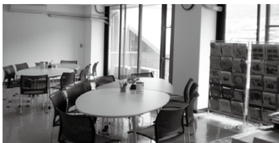
日当たりのよい場所です。コーヒーあります☆(セルフサービス)

どなたでも無料で利用できますが、原則ボランティア・市民活動交流センターへの登録が必要になります。事前に予約をすることもできます。打ち合わせ、サークル活動などにご利用下さい。