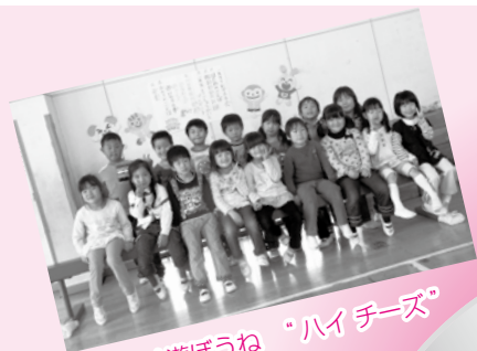
仲良く遊ぼうね “ハイチーズ”

知っているようで知らない オトコとオンナの恋愛心理学 「脳で知る!男女のコミュニケーション術」 相手を知るためには、まず自分を知ること! この講座は、本当の自分らしさを発見して第一印象を再確認し、 あなたの魅力をさらに引出し、よき相手、よき理解者をつつける ためのサポートとして開催します。