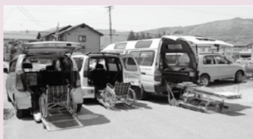
移送自動車・車いす貸出事業