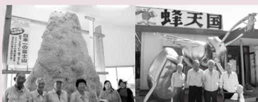
支部社協活動事業（障害者希望の旅）