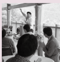
結婚相談事業（安曇野ツアー）