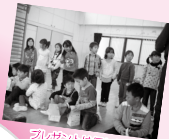
プレゼントは何かな?