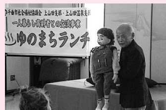
「一人暮らし高齢者の昼食会」