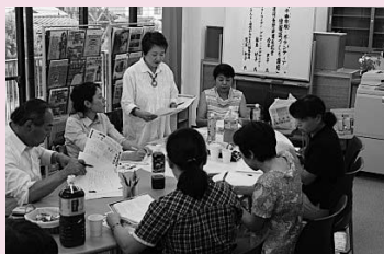
▲「情報誌づくり講座」

ボランティア・市民活動交流センターを開所し、交流の場や情報発信、機材の貸出など活動の核として多くの利用があり、住民主体の地域活動を側面的に支援しました。