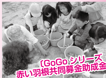
〔GoGoシリーズ 赤い羽根共同募金助成金事業〕