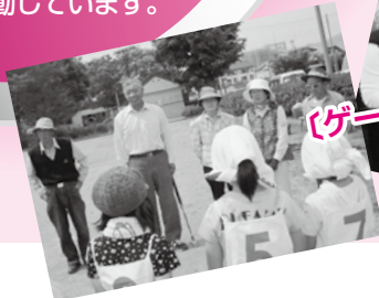
〔ゲートボール協会〕