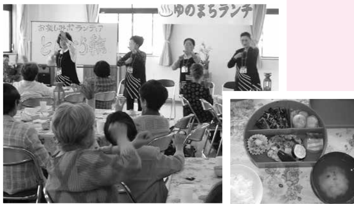
—1人暮らし高齢者の昼食会での1コマ（支部事業）—