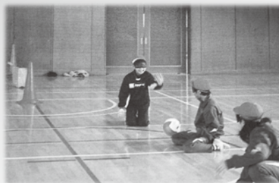
視覚障害者用バレーボールを使ったフロアバレーボールの体験風景（埴生小学校）