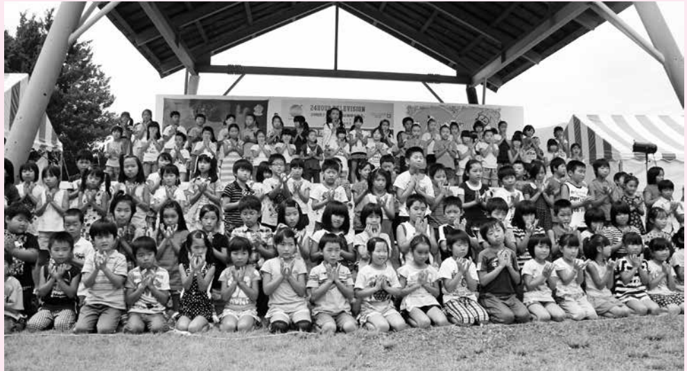
♪ ちいさいはなやおおきなはな ひとつとしておなじものはないから NO.1にならなくてもいい もともととくべつな Only One ~♪

市内9つの児童館・児童センターの子ども達17人が集まり、手話ソング「世界にひとつだけの花」千曲っ子バージョン」を歌いました。人の生き方を示してくれる曲として、合併後の10年間と同じ時を歌い継がれてきたスマップの名曲です。各館では6月から練習を積み、ノリノリで歌うようになっていました。