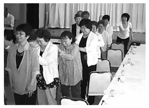
在宅介護者のリフレッシュ事業（支部事業） —日頃の介護の疲れを体操でリフレッシュ！—