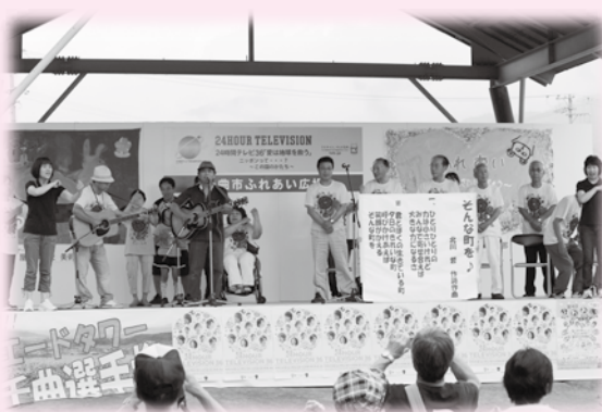
▲オープニング♪ 会場みんなで手話ソングを熱唱♪

今年も24時間テレビとのコラボでしたので、大勢の市民の皆さんが来場してくださいました。ふれあい広場がこれからも市民の大切なお祭りであるために、子どもも障害のある方も高齢の方も誰もが共に思いやるといふ初心を忘れずに続けてもらいたいな。すっかり大きくなった公園の木々を眺め、これまでの30年近い歴史のあるふれあい広場を思い起こしながら、そんなことを感じました。