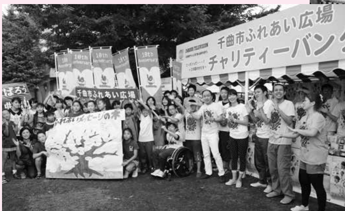
▲ ハートフル広場大集合