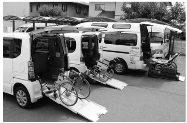
—車いすやストレッチャーで通院や 外出ができる車の貸し出し—