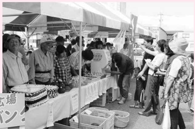
▲ は〜い いらっしゃ〜い♪

全員が合わせて歌うのは当日が初めてです。ステージ横の空き地でリハーサルをしました。練習時間はわずか10分、早速スタンバイ、あつという間に本番です。「No.1にならなくてもいい、もともと特別なOnly One...」自分の花を精一杯咲かすことの素晴らしさを、手話を交えて一生懸命に伝えていた子ども達でした。