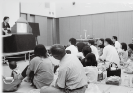
子育てサークルの様子（ちくまおはなしネットワーク）