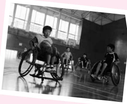
—車いすツインバスケット ボール体験（支部事業）—