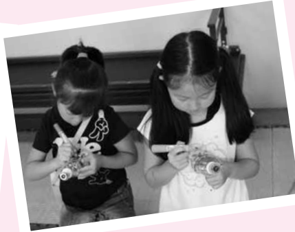
—地域のボランティアさんと 万華鏡づくり（支部事業）—

サマーチャレンジボランティア —中学生が福祉施設で ボランティア体験をしました—