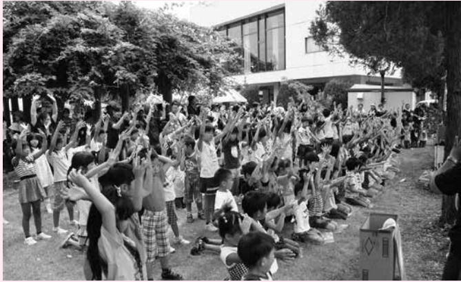
*初めて9館の仲間がひとつになってリハーサル

市内9つの児童館・児童センターの子ども達17人が集まり、手話ソング「世界にひとつだけの花」千曲っ子バージョン」を歌いました。人の生き方を示してくれる曲として、合併後の10年間と同じ時を歌い継がれてきたスマップの名曲です。各館では6月から練習を積み、ノリノリで歌うようになっていました。