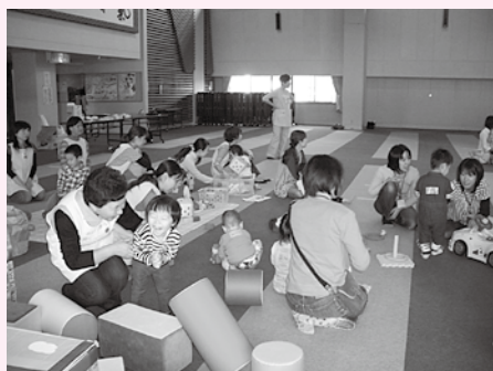
親同士、こども同士のつながりがつくれます♪