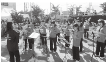
植生中／引き継いだばかりの1・2年生が元気な演奏を披露