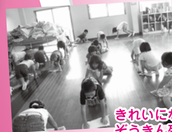
きれいになるよ! ぞうきん列車♪