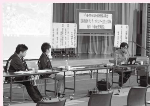
昨年度の災害救援ボランティアセンター立ち上げ訓練及び福祉避難室の様子