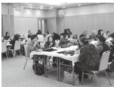
美味しい食事に話はずみです♪

「障害者希望の旅」はこれまで市の補助金を受けて開催してきましたが、今年度より支部社協独自の事業となりました。更埴地区支部社協は10月28日伊香保温泉、戸倉上山田地区支部社協は11月8日石和温泉へ行ってきました。普段なかなか外出できない障害をお持ちの方と介護者の方あわせて60名以上にご参加いただきました。参加者の皆様は、大きなお風呂に満足された様子で「大きくて気持ちよかったです！」「体がぼかぼかしているよー」といった声を聞くことが出来ました。素晴らしい秋晴れの中、多くの笑顔が見られ、素敵な旅行となりました。