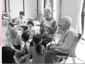
ささえあい千曲のみなさんとの ふれあい活動♪ ホットタイム!