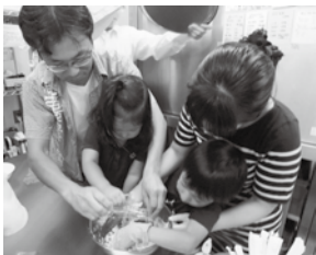
親子一緒クッキー作り体験

アトラクションは植生中学校吹奏楽部の演奏とスマイルズのチアダンスでしたが、とても元気なパフォーマンスで盛り上げてくれました。地域の皆様からご提供いただいたバザー用品もとても好評でした。ボランティアさんや地域の皆様に支えられ、無事に閉会しましたこと、感謝申し上げます。