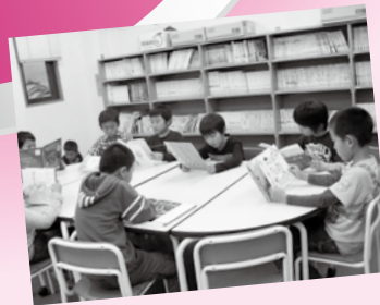
心静かに 図書館で♪