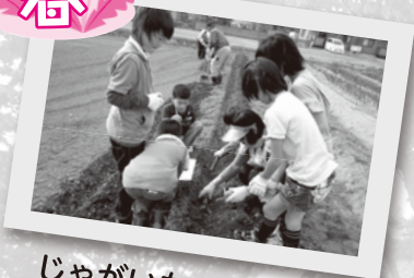
じゃがいもの種芋植え