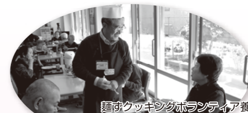
麵づくッキングボランティア養成講座