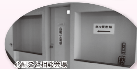
心配ごと相談会場