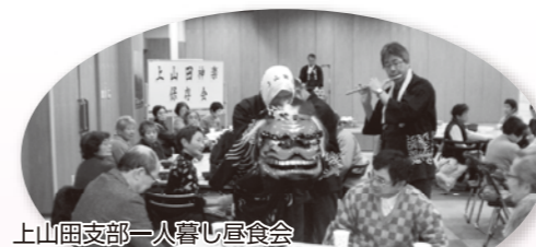
上山田支部一人暮らし昼食会