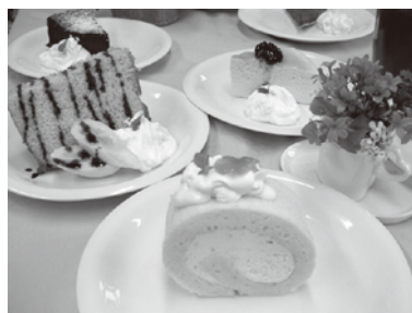
▲自慢の手づくりケーキ各種