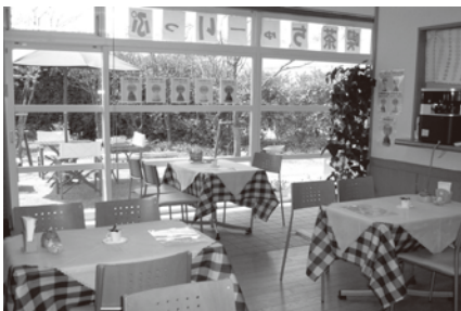
▲ホッと癒しの空間をあなたに・・・ 喫茶 ちゅーりっぷ店内