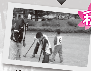
ゲートボール教室