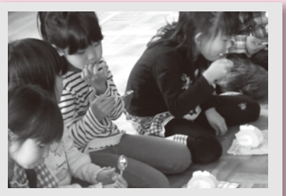
出し物も良かったけど、ケーキもおいしかったよ！～お誕生日会～