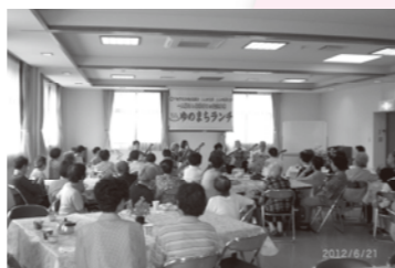
「ゆのまちランチ」に多勢参加