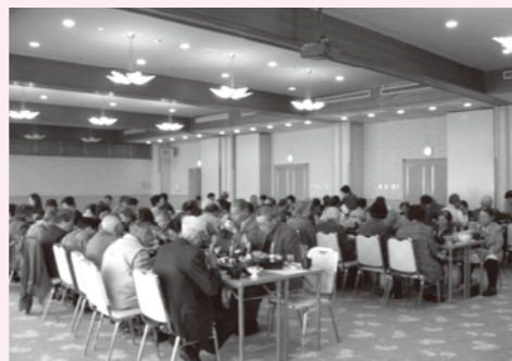
「独り暮らし高齢者・介護者の交流会」

また、お弁当の配布、戦没者慰霊祭、役員研修、福祉団体への助成など様々な活動をしています。