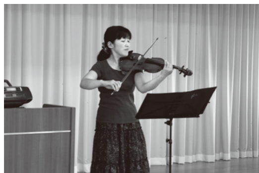
「一人暮らし高齢者の昼食会でのバイオリン演奏」

戸倉地区3支部では、8月29日（水）に在宅介護者のリフレッシュ事業を行う予定です。