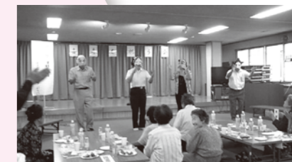
「喜寿を祝う会」で楽しい時を

又、一人暮らしの方達へあけぼの会の皆さんが、手作りおやき、ぼた餅等をお配りしています。