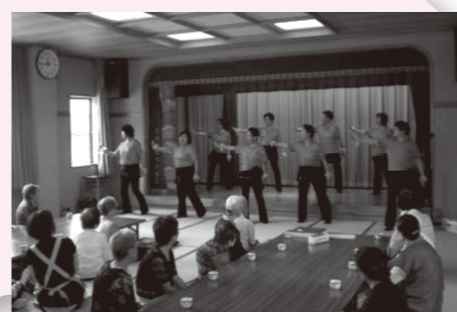
ダンスを見ながら「ぬくもり昼食会」

ひとり暮らしの高齢者を対象にした「ぬくもり昼食会」や在宅で介護をしている方々へ癒しの提供を目的とした「在宅介護者のつどい」等の事業を開催しております。住民参加を主体とし、地域に密着した活動の推進を目指しております。