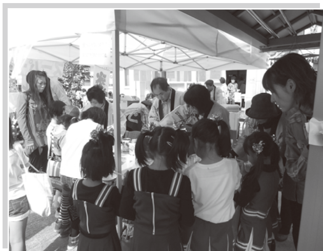
毎回、人気のスライム作り

バザー用品等の提供をしてくださった地域の皆様・お祭りにご協力いただいた全ての方々に感謝いたします。有り難うございました。