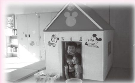
▲去年完成した牛乳パックの家2代目です。