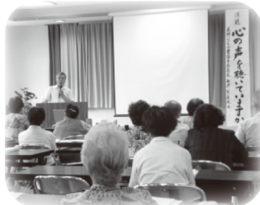
相手に寄り添う 大切さをおしえていただきました。

一般市民の皆様と共に、傾聴についてより深く学ぶことができました。今後も優しい社会の実現を目指して傾聴ボランティア活動を行っていきます。