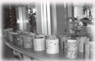
▲ペン立て、ジュズ玉プレスレットも作りました、クリスマスリースも作るよ。

更級児童館 では、一輪車が大はやりです。去年までは外の練習だけでしたが、今年は室内で出来るようになりました。また、毎月工夫した「工作」を取り入れ、限られた時間を楽しんでいます。更級児童館、楽しいよ。