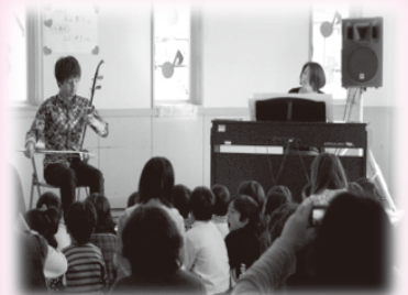
▲心に染み入る音色に引き込まれました。寝てしまうお子さんも。