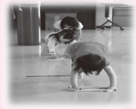
▲お掃除、午後4:45からアイネ・クライネ・ナハトムジークの曲で始まります。