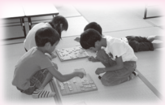
▲学年関係なし、将棋対決!時々チェスも。