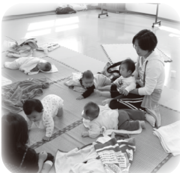
赤ちゃんとのふれあいで、心もほかほかになりました。

赤ちゃんに優しく声を掛けながら、マッサージが始まり歌に合わせたり途中、子育ての話に夢中になったり。ママの笑顔で赤ちゃんはニッコリ。赤ちゃんのニッコリでママもニッコリ。友達作りの場、情報交換の場にもなっています。