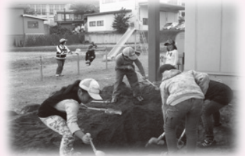
▲砂遊び!穴を掘るだけでも楽しいよ。

更級児童館 では、一輪車が大はやりです。去年までは外の練習だけでしたが、今年は室内で出来るようになりました。また、毎月工夫した「工作」を取り入れ、限られた時間を楽しんでいます。更級児童館、楽しいよ。