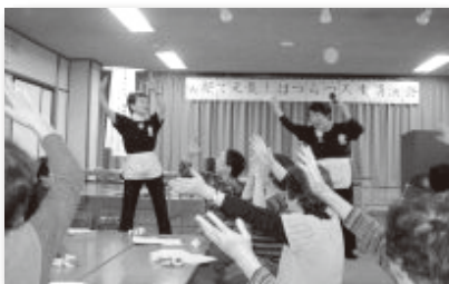
▲はつらつ人生「ワッハッハッ!」

支部社協では、今後も地域のつながりを大切に、互いに支え合い、健やかに生きがいを持って暮らしていただけるように地域に密着した地域づくりを推進してまいります。こうした事業も住民の皆様からの暖かい会費、赤い羽根共同募金を財源に展開しております。今後もご協力をお願いいたします。