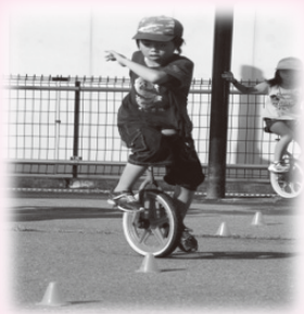
▲もう1級クリアー、頑張って検定だ!