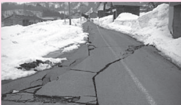
大きな亀裂が入った道路

(結いでお手伝いさせていただくメンバー)として各地域で困りごとをお聞きし、倒れたタンス起こし、飛散したガラス・食器類の片付け、雪かき等をお手伝いさせていただきました。また、市内の児童館より寄せられた「メッセージ」を栄村役場にお届けしました。