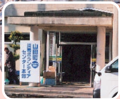
◀活動の拠点となる山田町災害ボランティアセンター

市内の60歳代男性が岩手県山田町(旧上山田町姉妹都市)で災害ボランティア活動(2泊3日)を行ってきた際の様子からです。 ※レポートは3ページをご覧ください。