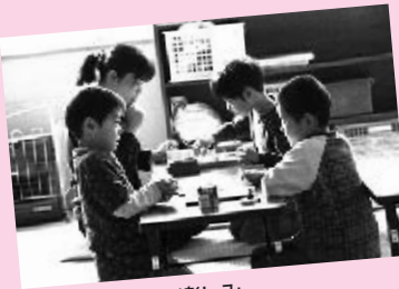
将棋やオセロも楽しみ

遊びで一番盛り上がるのが通称「かたき」、自分を当てた子が当てられると戻れるドッジボールの変形ゲームです。その他、フラフープ・トランポリン・キッカーボードなど、予約をしながら時間を守って遊び回っています。「牛乳パックの家」は大人気、「館長先生来て！」お招きいただきレストランでお食事：大人もごっこ遊びに浸り込んでいます。