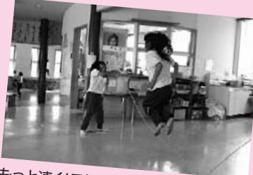
もっと速く！長縄です