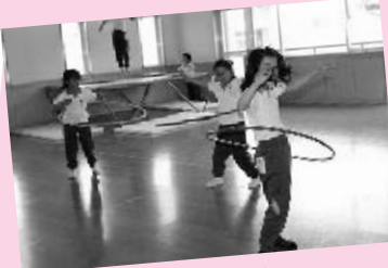
曲に合わせてノリノリです