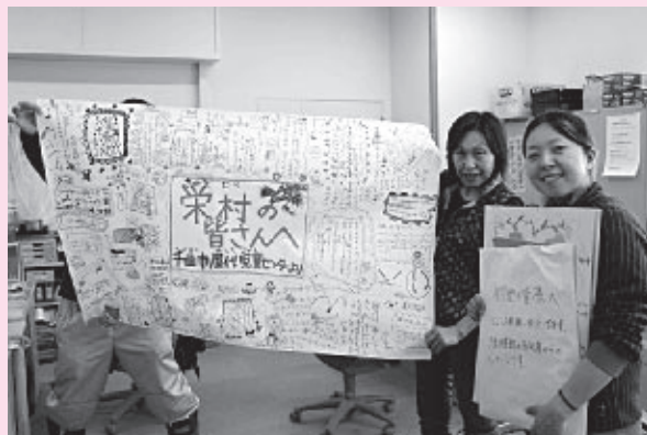
児童館からのメッセージを栄村役場にお届けする

栄村では、仮設住宅への入居が始まりましたが、まだまだ復興には時間がかかります。栄村支援のための義援金も受付けておりますので、皆さまの温かいご支援よろしく願いいたします。