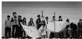
昨年は、巨大折り鶴をみんなで作りました。