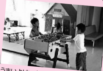
うまいよ！キッカーボード

今「牛乳パックの家(二号)」を作っています。学校と違って時間の確保が難しく子ども達の作業がなかなか進みません。一緒に作りませんか！お願いをするかもしれません。「共々に」を大事にしていきたい更級児童館です。