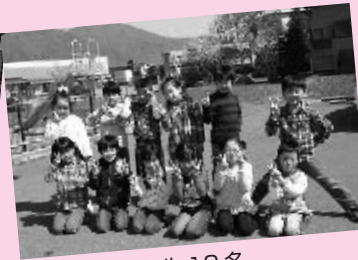
個性豊かな1年生 12名

一区切りをつけてさあ遊び！脱兎の如く遊びの場へ駆け出して行く元気な更級の子です。