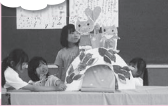
3年生が頑張ってくれた七夕ストーリー