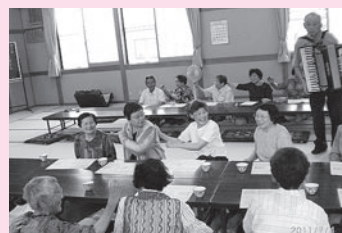
若宮地区でのぬくもり昼食会にて。

事業活動への支援として、講師や視察場所、事業内容等について支部社協へ積極的に関わりながら、連携を図ってまいりました。また、各支部事務局との連携を密にし、支部の支部長や役員との話し合う機会をできる限り多く作り、地域の福祉課題の把握に努めてまいりました。