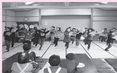
上山田小とサロンの交流会にて

センター運営については、運営委員会の積極的な提言を基に、ボランティアの方々が活動しやすいセンターとして環境を整えてきました。また、ボランティア活動では、災害に関する講座やサマーチャレンジボランティア、子育て支援、傾聴ボランティアなどを行ってまいりました。なかでも、ふれあい広場は、千曲市内で3か所行ってまいりましたが、22年度初めて市内1か所での開催が実現しました。今後も地域住民の福祉ニーズにこたえるべく、努力してまいります。