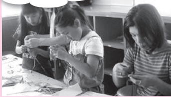
親子で楽しんだラベンダースティックとサッシュ作り

東部児童センターは、千曲市の東（生萱地区）に位置し、毎日東小学校の児童達のにぎやかな声で、活気に満ちています。やりたいこと盛りだくさん。楽しい行事も児童が率先して作り上げています。また月に1度の子育て広場も、小さなお友達でにぎやかに、毎回素敵な出会いが待っています。子育て広場にもぜひお出かけください。