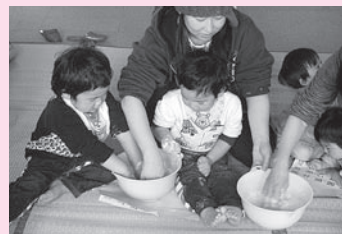
児童館での小麦粉粘土づくり

指定に向け、「選ばれる事業所」として職員の意識改革に努め、その結果として戸倉地域福祉センター、児童センター・児童館、デイサービスセンターなどが引き続き指定管理者として指定されました。市から指定管理の委任を受けて、高齢者や児童等の福祉増進を図るとともに、施設機能の向上と市民に親しまれる管理経営に努めました。