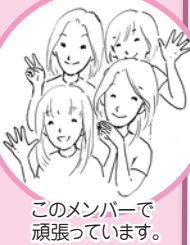
このメンバーで頑張っています。

子育て広場は、たくさんのお友達で活動中!!歌ったり、元気よく体操したり、簡単工作やパネルシアターも。楽しいことがいっぱい