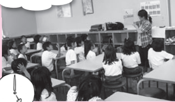
おやつ後のホッとひと息。毎日の読み聞かせ