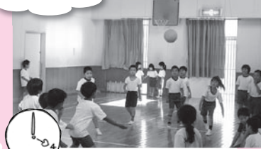
毎日かかすことの出来ないドッチボールは活気にあふれて