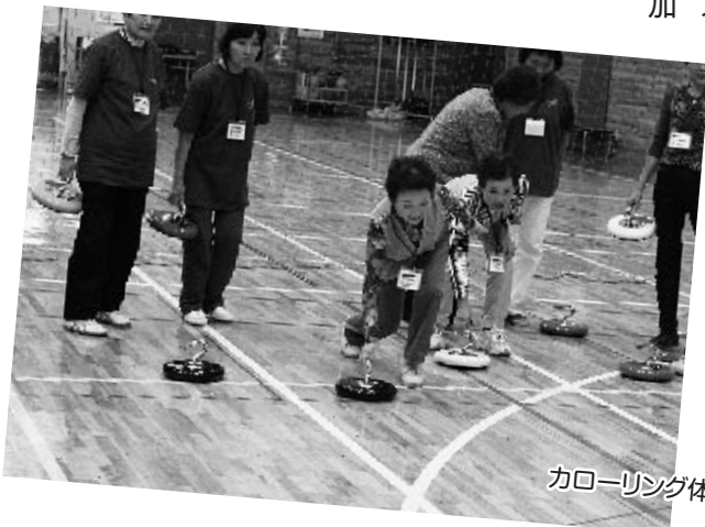
カローリング体験