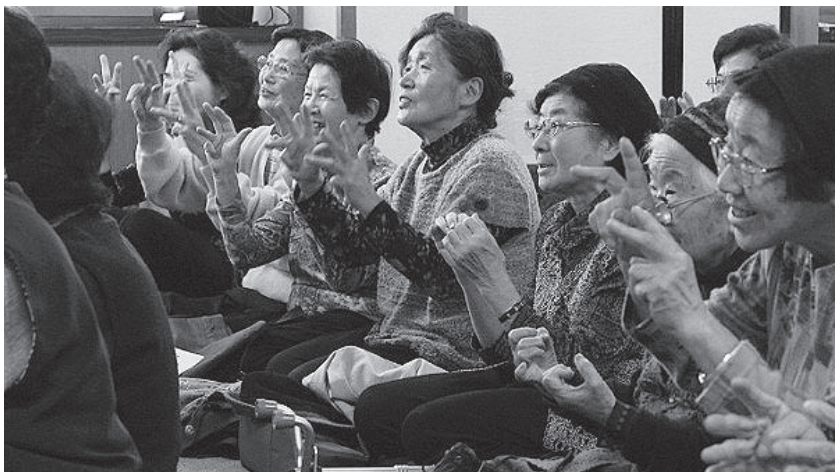
「それ! 1・2・3・・・」 かけ声にあわせ、楽しく体操を実践