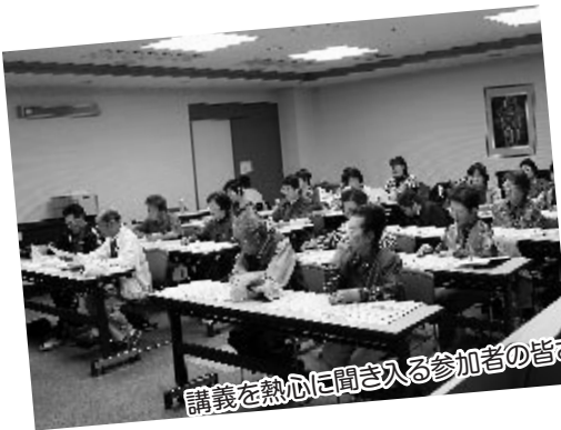
講義を熱心に聞き入る参加者の皆さん