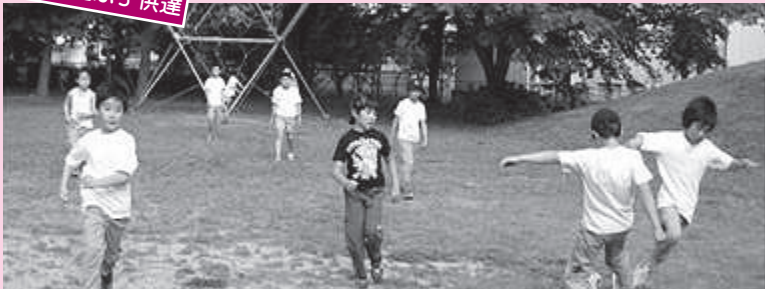
元気に遊ぶ子供達

五加児童館（登録児童六十三名）のすぐ隣に「五加之庄花緑コミュニティパーク」という公園があります。名前のとおり、自然ゆたかな公園であり、児童はそこで思う存分遊ぶことができます。毎年、五月下旬、地域の方が花壇に花の苗をたくさん植えて下さいます。