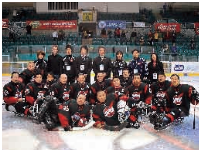
アイススレッジ日本代表

社会福祉法人 千曲市社会福祉協議会 〒387-0011 千曲市杭瀬下二丁目6番地 TEL.026-272-0252 FAX.026-272-6557 http://www.valley.ne.jp/~shakyokc/