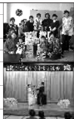
◀子育て支援事業 牛乳パック再利用