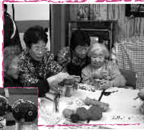
芝刈りくん 孫のようにかわいいね