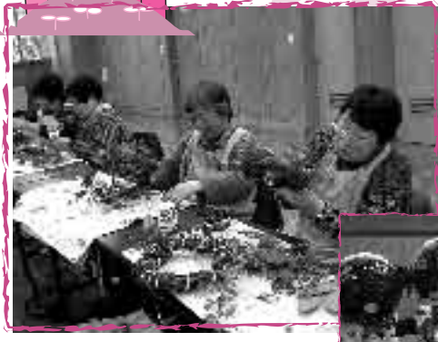
さつま芋のついでクリスマスリース作り