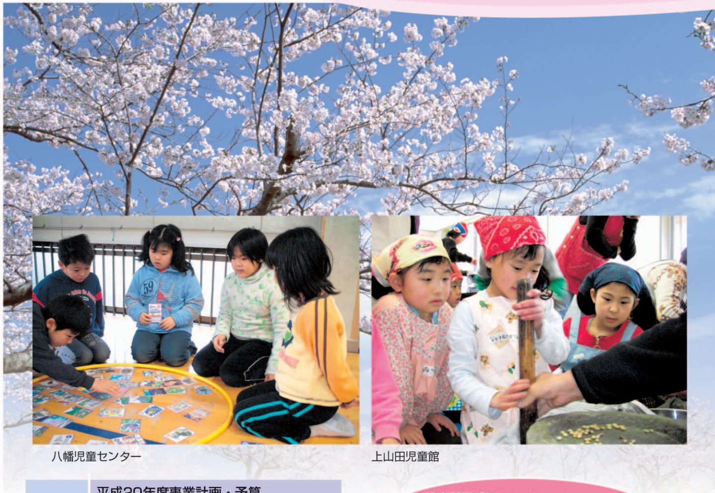
八幡児童センター

社会福祉法人 千曲市社会福祉協議会 〒387-0011 千曲市杭瀬下二丁目6番地 TEL.026-272-0252 FAX.026-272-6557 E-mail: shakyokc@valley.ne.jp