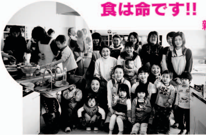
「ばくも お手伝い 頑張ったよ!」