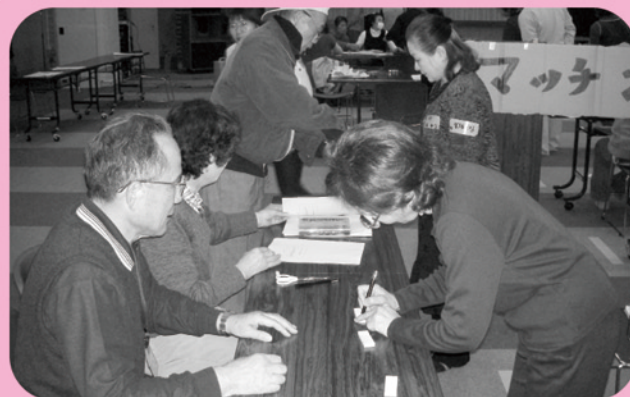
▲ 災害救援ボランティア立ち上げ訓練