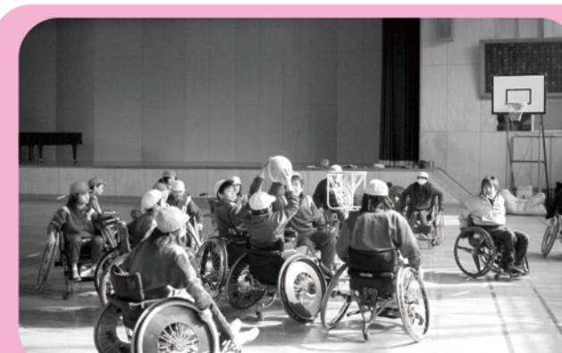
▲ 車いすバスケットボール体験