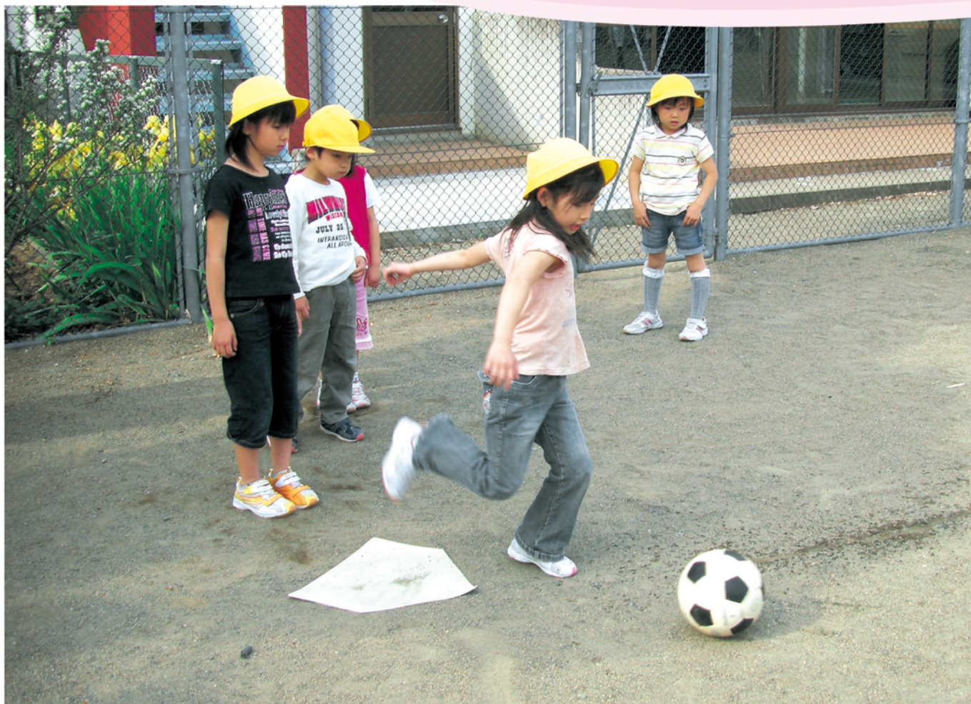
屋代児童センター

社会福祉法人 千曲市社会福祉協議会 〒387-0011 千曲市杭瀬下二丁目6番地 TEL.026-272-0252 FAX.026-272-6557 E-mail: shakyokc@valley.ne.jp