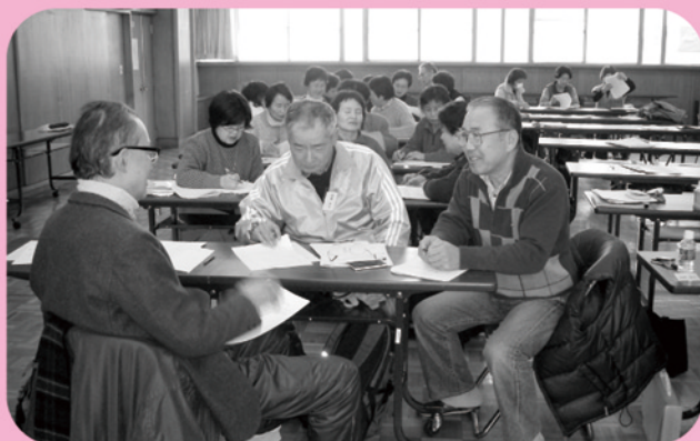
▲ 傾聴ボランティア養成講座