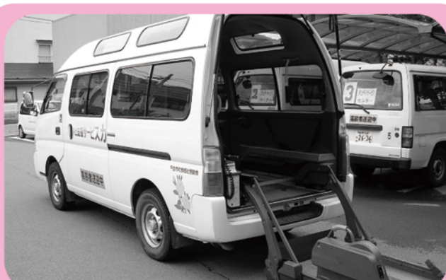
▲ 移送自動車貸出事業