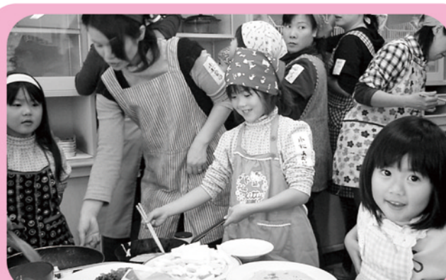
▲ 環境にやさしくエコクッキング