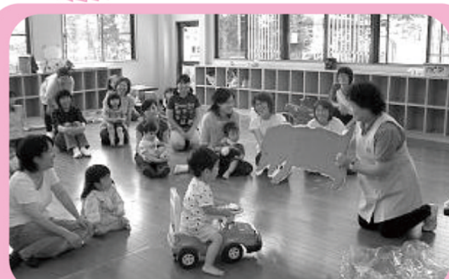
▲ 子育てサロンリーダー研修会