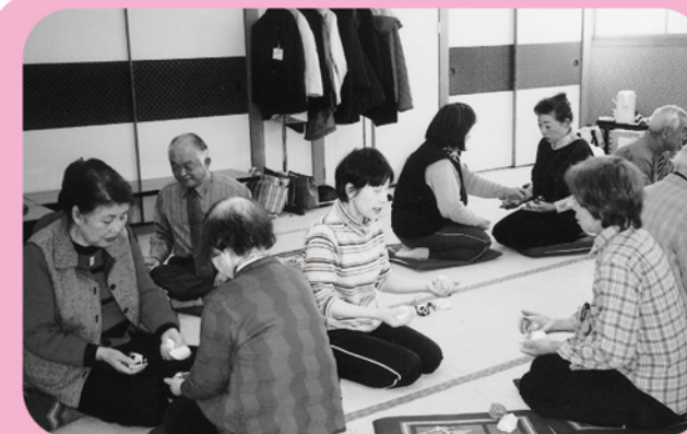
▲ 在宅介護者リフレッシュ事業