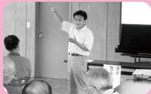
▲ 男性のための介護ボランティア入門講座