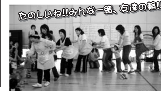
たのしいね!!みんな一緒に、友達輪!!

子育ての基本は、「お母さんが元気で笑顔でいること」ですね!!お母さん方の輪が広がる事を祈っています。