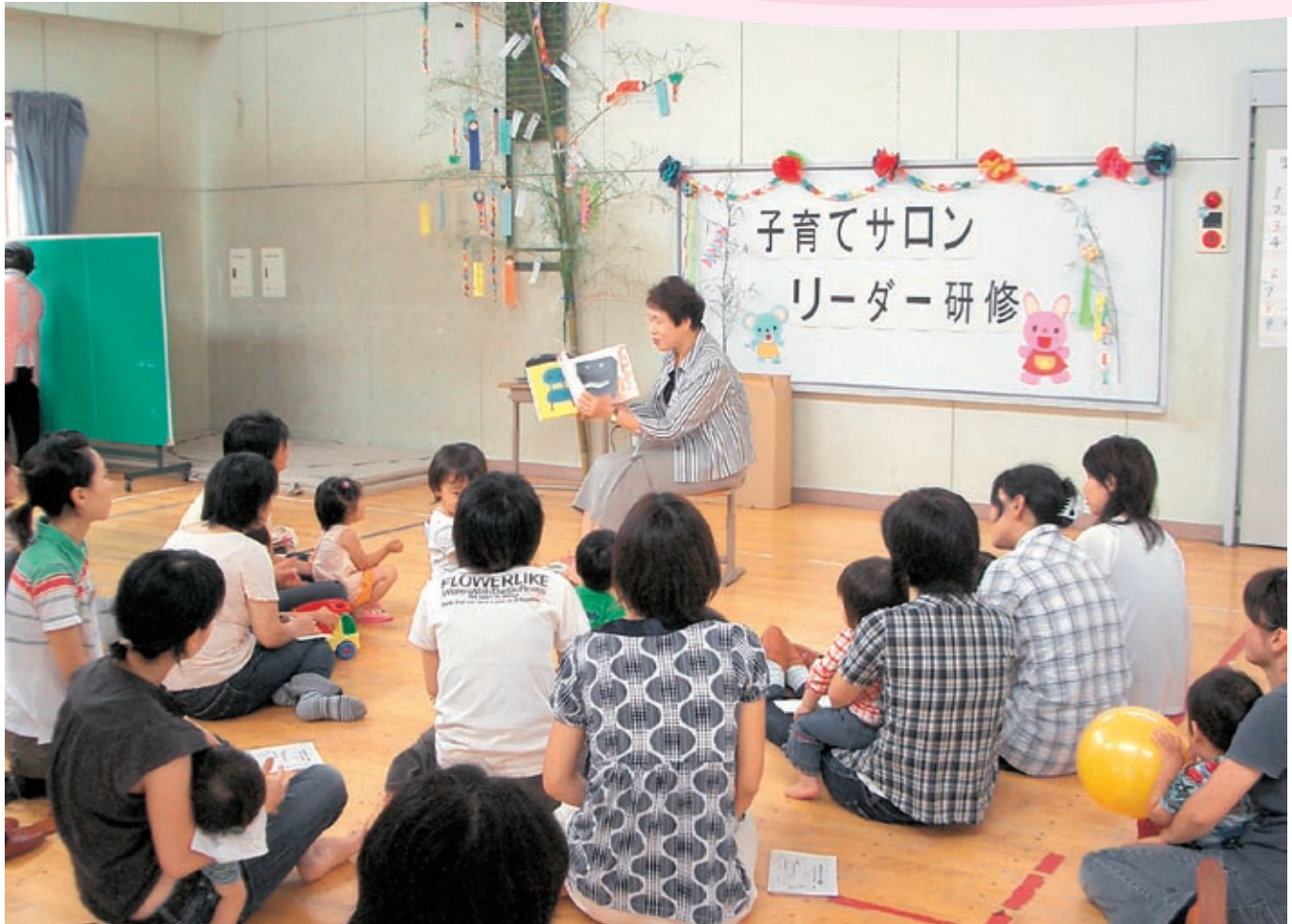
八幡児童センター

社会福祉法人 千曲市社会福祉協議会 〒387-0011 千曲市杭瀬下二丁目6番地 TEL.026-272-0252 FAX.026-272-6557 E-mail: shakyokc@valley.ne.jp