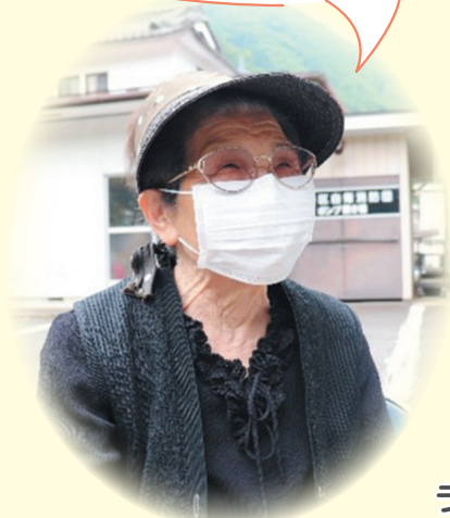
倉科地区の ラジオ体操サロン