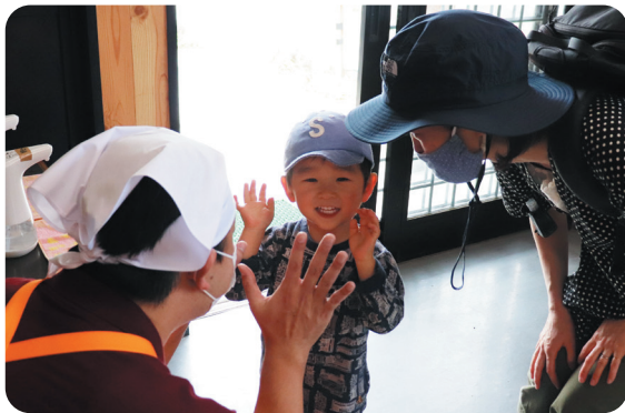
おいしかったよ♪ また来てね

さんは「一人の力では、こども食堂はできない。地域の皆様のご協力のおかげで運営できています。支援者の方々と支えあい、こども食堂という場を開き続けることで、様々な人同士が繋がり、笑顔になることができます。皆様からの温かいご支援お待ちしております。お気軽にお立ち寄りください。」と話されました。今後子ども達にとって楽しい居場所となり、多世代の地域のふれあいの拠点になればと期待しています。2階は、学習支援も行えるようになるそうです。