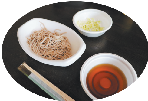
振る舞われた 手打ちそば

※「かみとくま食堂」の対象者は20歳未満の子どもと保護者等。利用料は無料。毎月第2、4水曜日の午後3～5時。2階は学習スペースとして開放しています。