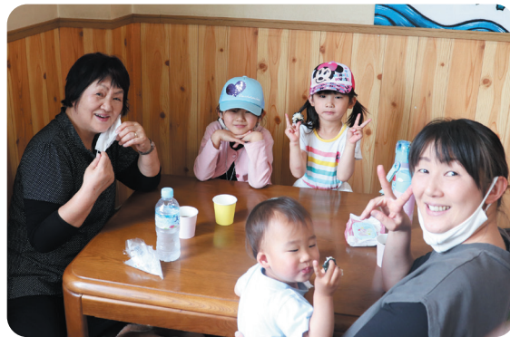
とても居心地がいいよ