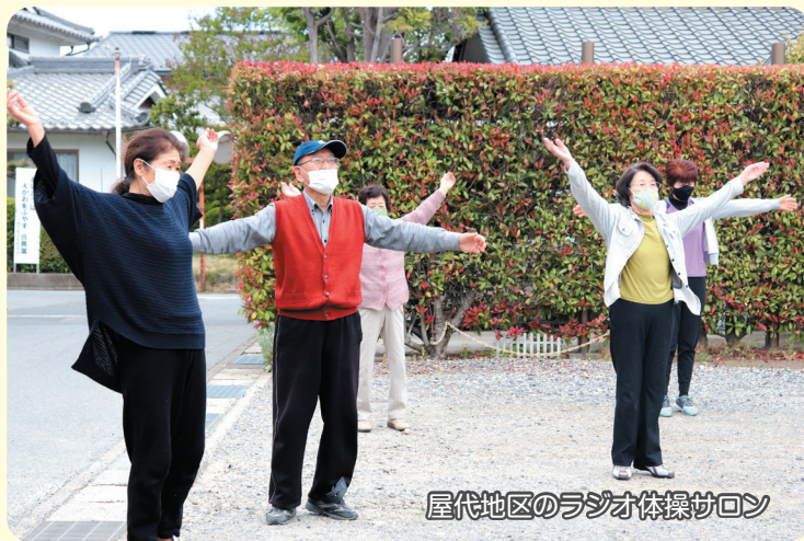
屋代地区のラジオ体操サロン